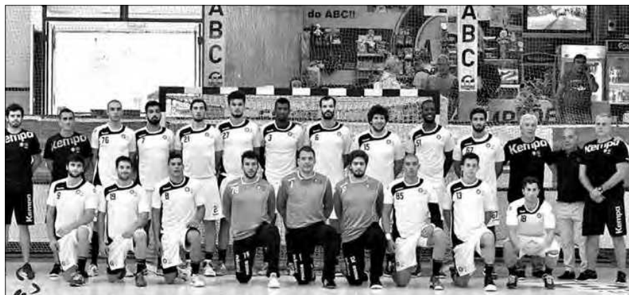
ABC visita hoje Madeira SAD

Os jogos de hoje: Madeira SAD-ABC/UMinho, Sporting-Avanca e Benfica-FC Porto.