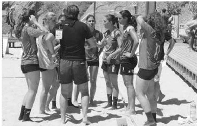
Verde-rubras estrearam nos Nacionais da modalidade.

Quanto ao campeão feminino veio a ser o 'As 100 Ondas' que na final viriam a vencer os 'Z'Imboira' por 2-0, enquanto o 'N8.N80' conquistou o bronze. P. V. L.