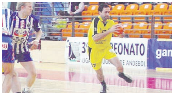
Brecha na linha defensiva do FC Porto