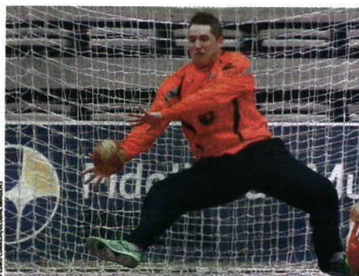
Ativo Seleção poderá ter um titular sem jogar