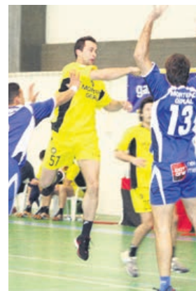
Ataque à defensiva do Belenenses