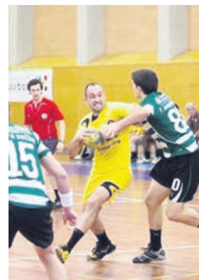
Bloqueado por adversário do Sporting

LB — O ABC continua a ter tudo mas em mais pequeno. Tinha um orçamento de mil, tem um orçamento de cem. Em vez de ter muitos jovens na formação já tem poucos. Penso que quando a economia voltar a crescer, quando houver melhores condições para dar aos atletas, o ABC pode voltar aos níveis que já teve antes.