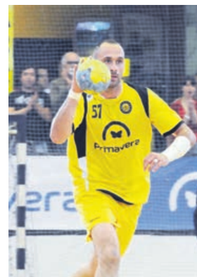
Prepara contra-ataque frente ao Benfica