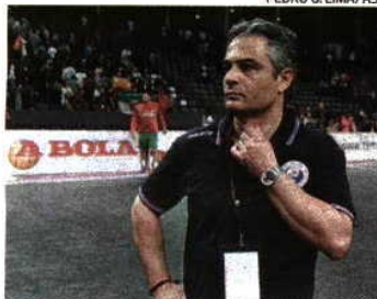
O selecionador Rolando Freitas

A Nazaré vai receber a Seleção masculina a 30 de Outubro, para o primeiro jogo da equipa de Rolando Freitas rumo ao Mundial do Catar-2015. Além da Letónia, seleção com a qual os portugueses se estreiarão no grupo de qualificação europeia rumo ao play-off, Portugal conta com Bósnia e Estónia por rivais, dado que apenas o vencedor do grupo conseguirá lugar no play-off — junho de 2014 —, derradeira etapa de acesso ao Mundial. A 3 de novembro, Portugal jogará na Bósnia, mas só no início de 2014 tudo se decidirá. A 2 de janeiro, a Seleção joga na Estónia, recebendo a mesma equipa a 4 ou 5. Sem tempo a perder, dia 8 ou 9 haverá viagem até à Letónia para depois, em casa, se fazer a receção aos bósnios, a 11 ou 12 de janeiro, e encerrar a qualificação.