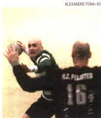
Leões conhecem adversário na Europa