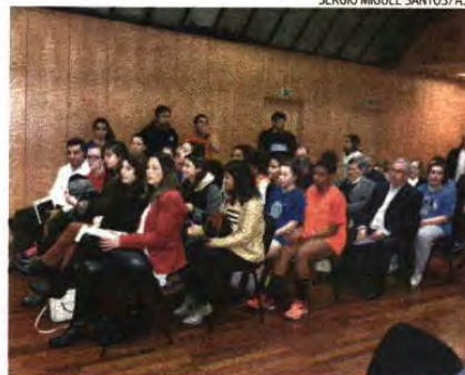
Jogadoras do Passos e figuras da modalidade presentes