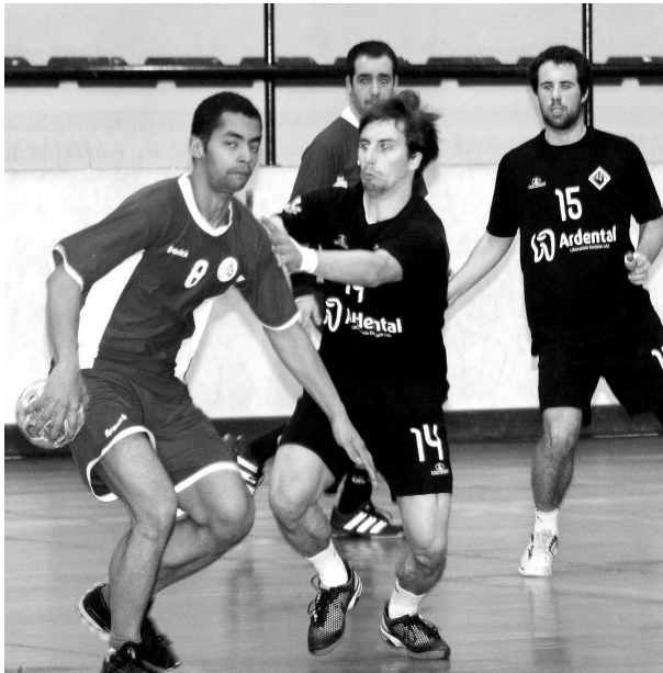
Académica fechou 1.ª fase com uma derrota por nove golos

ANDEBOL No último jogo da 1.ª fase da Zona 3 do Campeonato Nacional da 3.ª Divisão os estudantes sofreram a sexta derrota da temporada, não sendo felizes na deslocação a Santarém, isto depois de na semana anterior terem ficado sem possibilidades de apuramento para a 2.ª fase, após a derrota pela margem mínima na casa do líder Juve Lis.