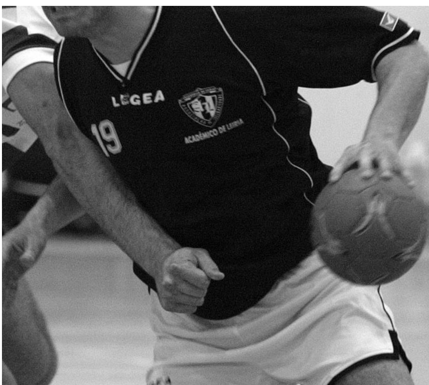
EQUIPA de Pombal foi a única a sair vitoriosa em andebol no último fim-de-semana

Com estes resultados, a equipa do Sismaria desce para o 7.º lugar, com cinco pontos, enquanto que a Juve Lis está no 10.º e último lugar com apenas três pontos.