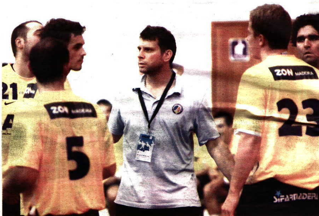
Os técnicos da equipa madeirense estão confiantes na conquista de uma vitória.