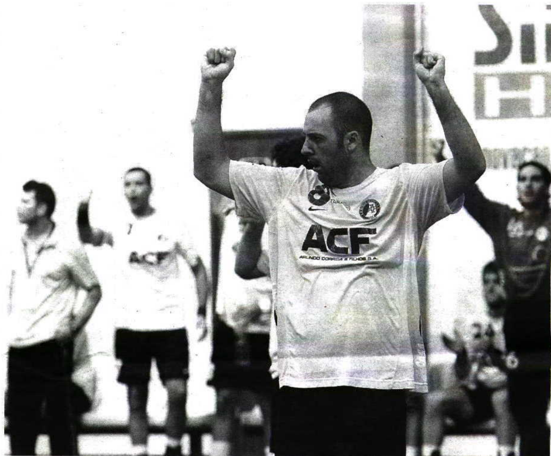
Os jogadores do Madeira SAD festejaram a segunda vitória no campeonato.