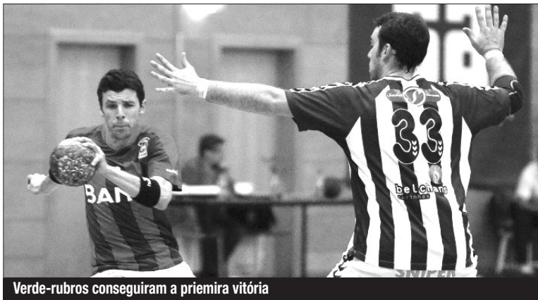
Verde-rubros conseguiram a primeira vitória