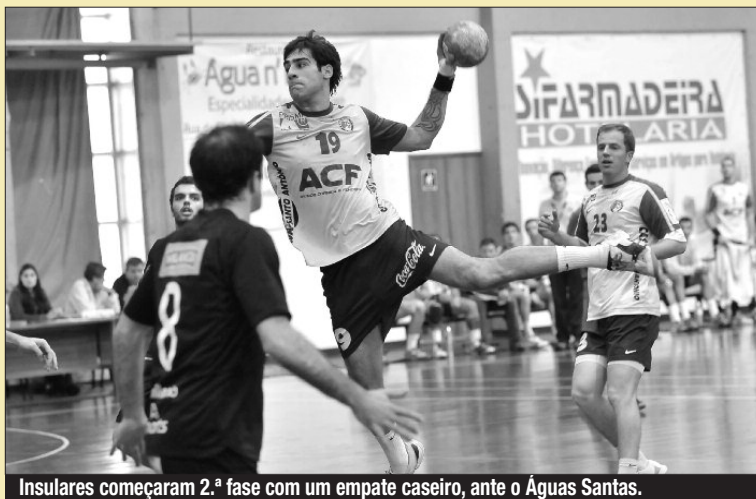
Insulares começaram 2.ª fase com um empate caseiro, ante o Águas Santas.