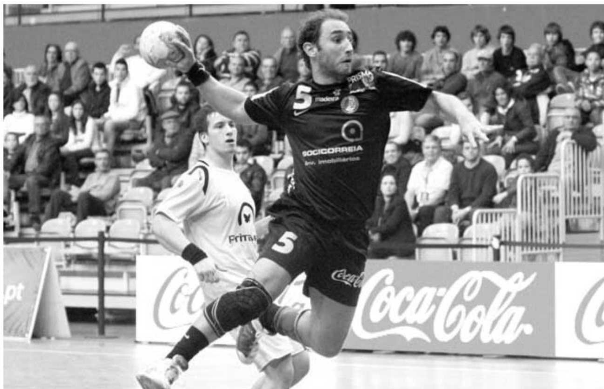
O Madeira SAD e Gonçalo Vieira realizaram grande jogo, agora em casa do ABC.

HERBERTO D. PEREIRA desporto@dnoticias.pt