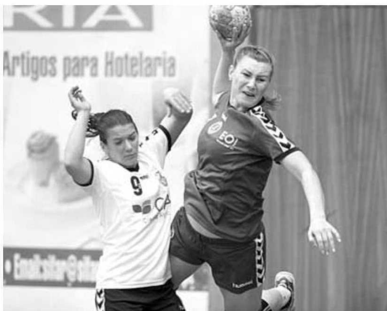
O Madeira SAD teve tarefa fácil no reduto do Académico FC.