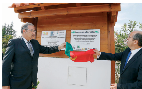
'Hortas da Vila' foram inauguradas quinta-feira

Os utilizadores apenas têm que garantir o cultivo do espaço, mantendo-o em bom estado de utilização, sendo que não existem custos. «