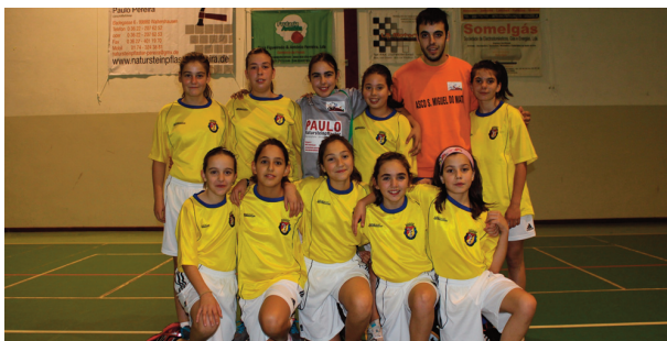
Jovens de Vouzela competem em Leiria