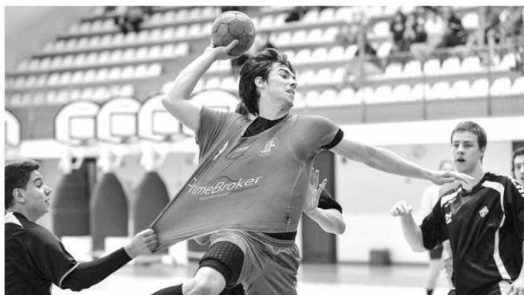
Madeirenses voltam a jogar hoje, agora em casa do Benfica.

Santas por 25-21, mas depois de ter estado a vencer ao intervalo por 8-11. Com quatro jogos já realizados, nesta fase final os madeirenses ocupam o quarto lugar de uma classificação que é liderada pelo Águas Santas e ABC. Hoje os 'estudantes' jogam no reduto do Benfica, pelas 19 horas.