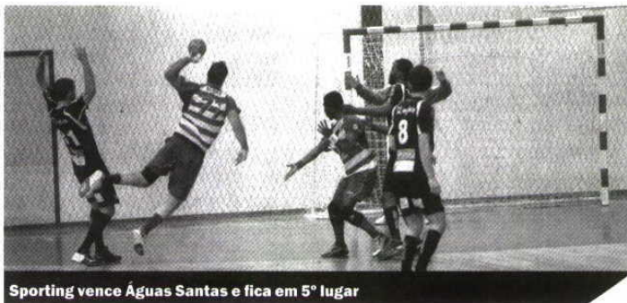
Sporting vence Águas Santas e fica em 5º lugar

Em casa, o Sporting da Horta tinha empatado com o Águas Santas por 27-27, no primeiro jogo deste play-off.