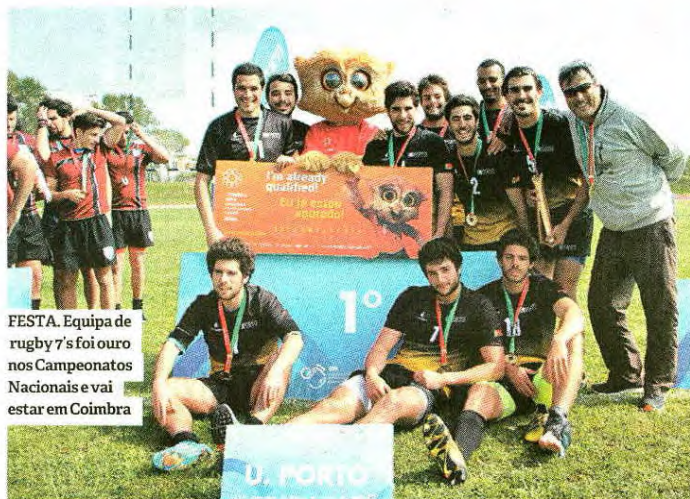
FESTA. Equipa de rugby 7's foi ouro nos Campeonatos Nacionais e vai estar em Coimbra