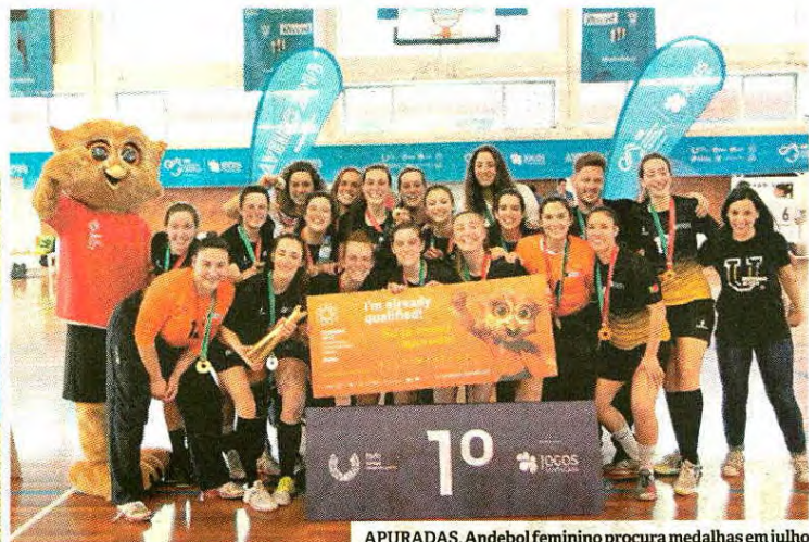
APURADAS. Andebol feminino procura medalhas em julho

Seis medalhas de ouro nos Campeonatos Nacionais e no horizonte estão os Jogos Europeus