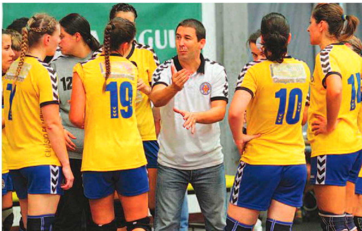
O Madeira Andebol SAD conquistou o título de campeão mas pouco sabe do seu futuro