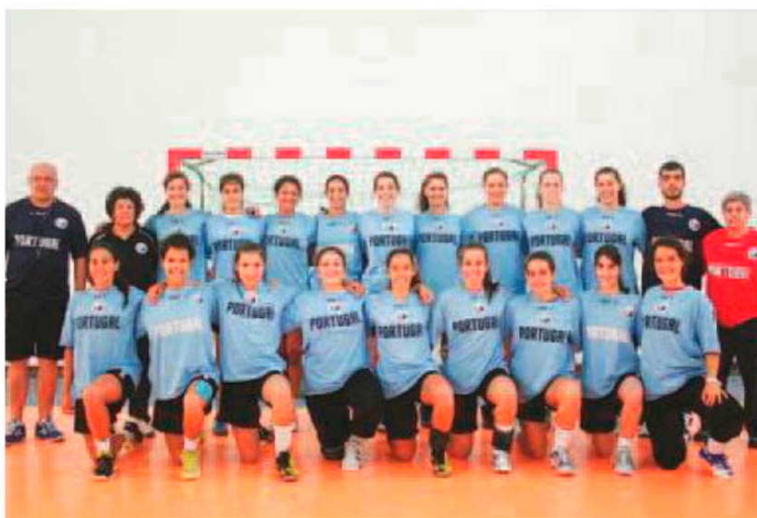
Portugal começa campeonato defrontando hoje a Angola.

Nesta fase de grupo Portugal tudo fará para atingir os dois primeiros lugares de forma a conseguir rumar à fase final, onde irá poder discutir o título mundial. P. V. L.