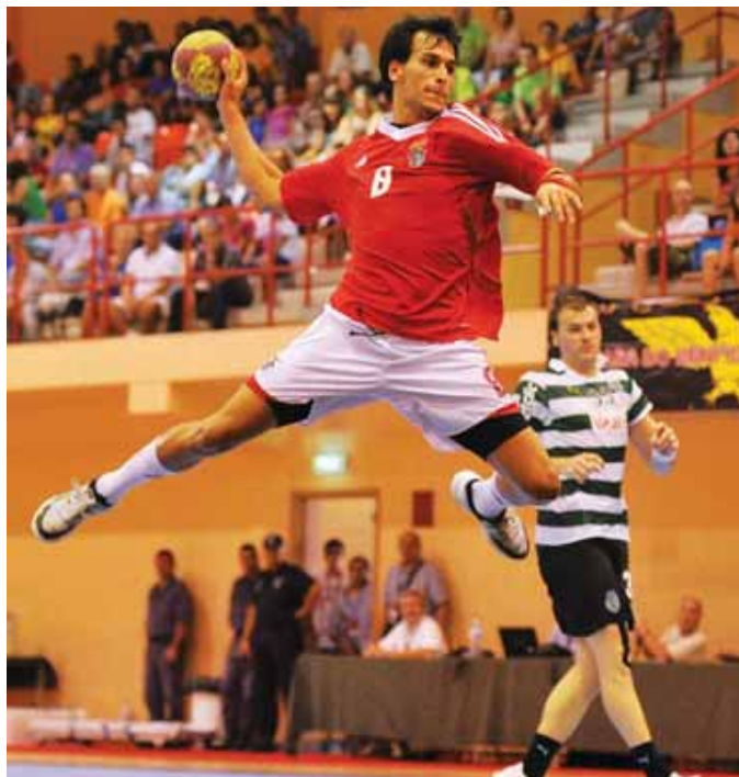
Sporting e Benfica jogam no sábado, dia 25 de agosto