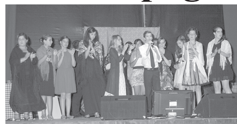
O 1.º Concurso de Karaoke «Alma na Voz» foi dedicado ao fado.

«As novidades deste ano tiveram muita adesão. O 1.º Concurso de Karaoke «Alma na Voz» foi do agrado, quer dos participantes, alguns de fora do concelho, fruto da divulgação efectuada; quer da assistência e superou as expectativas. No Percorso Pedestre – PR8 «Trilho da Água e da Resina» tivemos 160 inscrições, o que tam-