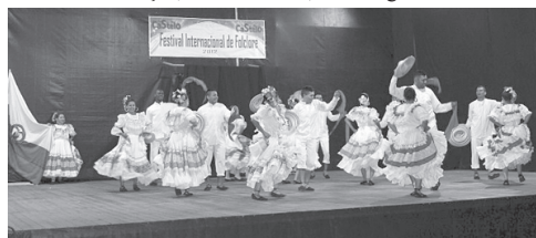
A Companhia Artística Estampas, da Colômbia foi uma das participantes no Festival Internacional de Folclore.

jos arrancaram na quarta-feira com o Concurso Pecuário, no espaço da Feira Mensal, que este ano contou com 58 animais, sendo 21 bovinos das raças mirandesa e arouquesa; e 37 caprinos. Esta foi a 42.ª edição do concurso, cujos objectivos são promover o convívio entre produtores, incentivar e divulgar a actividade pecuária na região de Lafões e premiar a qualidade dos animais. Em 2012, houve uma diminuição de 16 animais, com menos cinco bovinos e menos oito caprinos, mas a qualidade mantém-se. A noite actuou a Sociedade Musical Vouzelense que, como é tradição, juntou muito público que aplaudiu com entusiasmo o repertório apresentado.