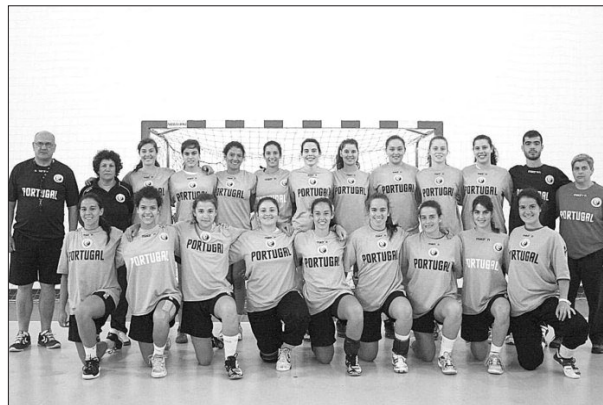
Selecção nacional sub18 estreia-se hoje frente à congénere angolana.

O objectivo da selecção nacional passa chegar os mais longe possível na competição, tal como reconheceram as jogadoras madeirenses em recente entrevista ao JM. □