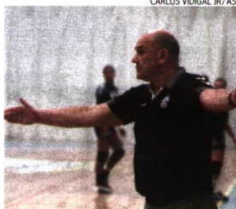
CARLOS VIDIGAL JR/ASF