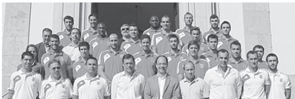
Os jogadores e equipa técnica do Benfica, com os responsáveis do Município e técnico do desporto, o presidente da Associação de Andebol de Viseu e alguns patrocinadores.

«Quando se fala em investimento no desporto há sempre um reverso e a presença do Benfica é para termos dividendos em termos de imagem do Município. É com muita honra que vos recebemos novamente durante uma semana. Tudo fizemos mais uma vez para que se