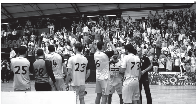
Andebolistas do ABC/UMinho agradecem apoio dos muitos academistas presentes em Águas Santas

Abordando, depois, o futuro, o técnico dos academistas mostrou-se confiante dado a forma como «os jogadores mostraram que sentiram esta derrota». «Pelas suas expressões estou confiante que vão continuar a lutar, até final da época, pelos objetivos que traçámos. Temos seis finais, a próxima já contra o Benfica, e seis oportunidades para desfrutar na tentativa de devolver o