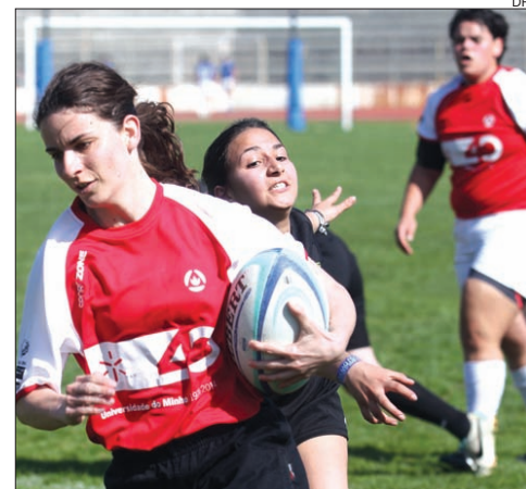
Equipa feminina de rugby da UM sagrou-se vice-campeã

As equipas de futsal, que defendiam os títulos conquistados em 2013, é que estiveram aquém das expectativas. No masculino, uma série de lesões afetou