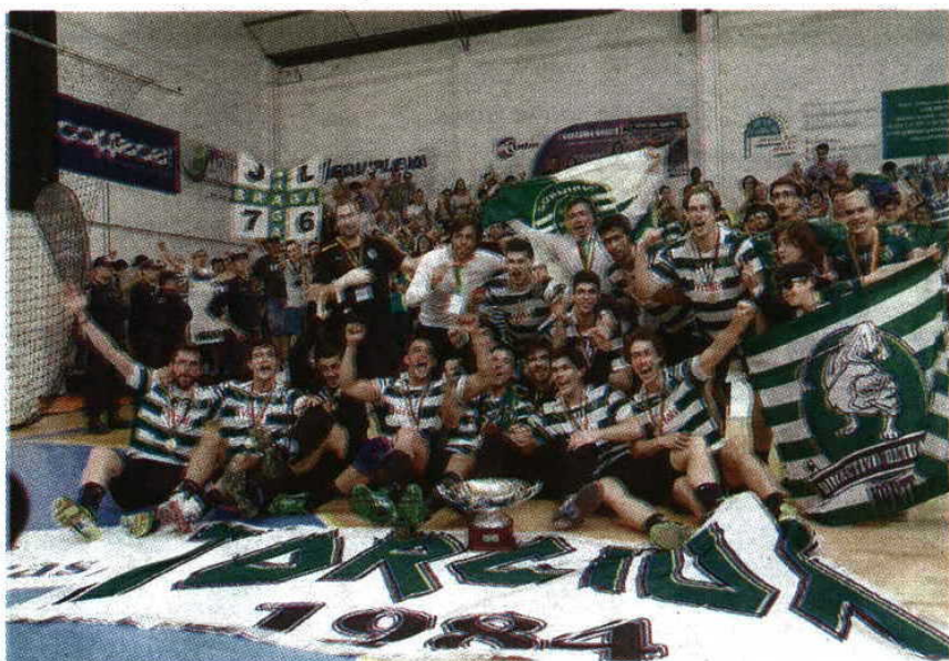
Leões festejam, pela terceira vez consecutiva, a conquista da Taça de Portugal