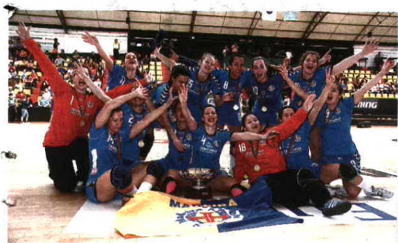
É NOSSA! Festa das madeirenses no Pavilhão de Águas Santas

VENCEU ALAVARIUM (29-26) NA FINAL FEMININA