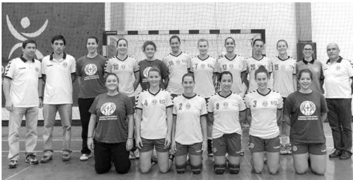
Atletas fizeram greve alegando a regularização de salários em atraso.