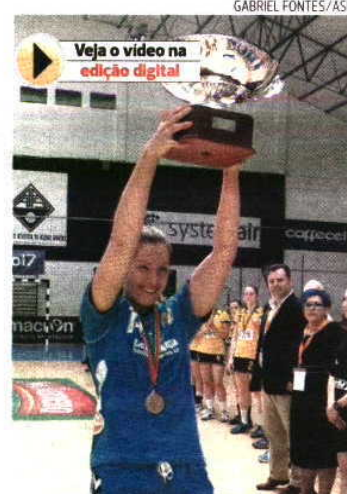
Madeirenses ganham 16.ª Taça consecutiva