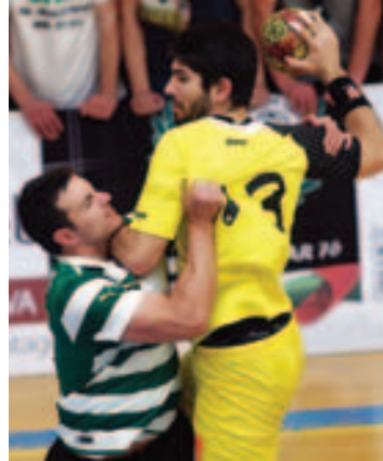
No duelo disputado ontem na Maia, a equipa do Sporting levou a melhor sobre a formação de Braga.