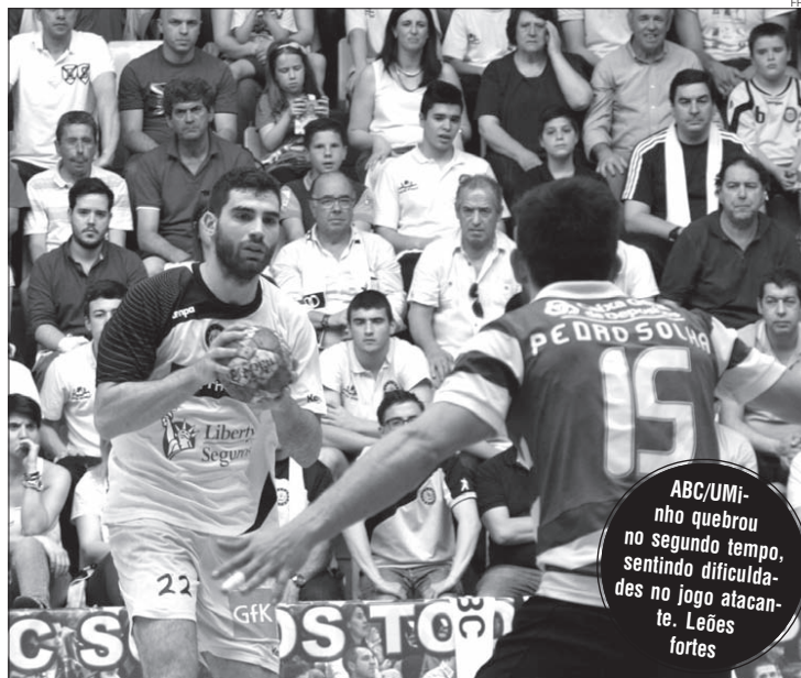
Fase do jogo entre a turma bracarense e o conjunto lisboeta

No segundo tempo, com a equipa "leonina" a mostrar grande mobilidade defensiva, tapando bem os caminhos da sua baliza, o ABC/UMinho não conse-