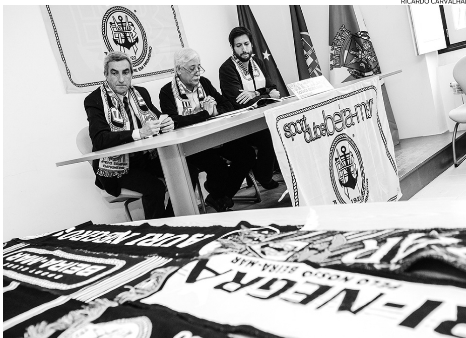
Equipa do projecto “Somos Beira-Mar” mostrou-se publicamente e com muitas ideias