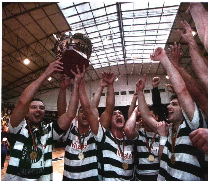
FESTA. Sportinguistas elevam a Taça depois de baterem o ABC e, antes, FC Porto e Benfica