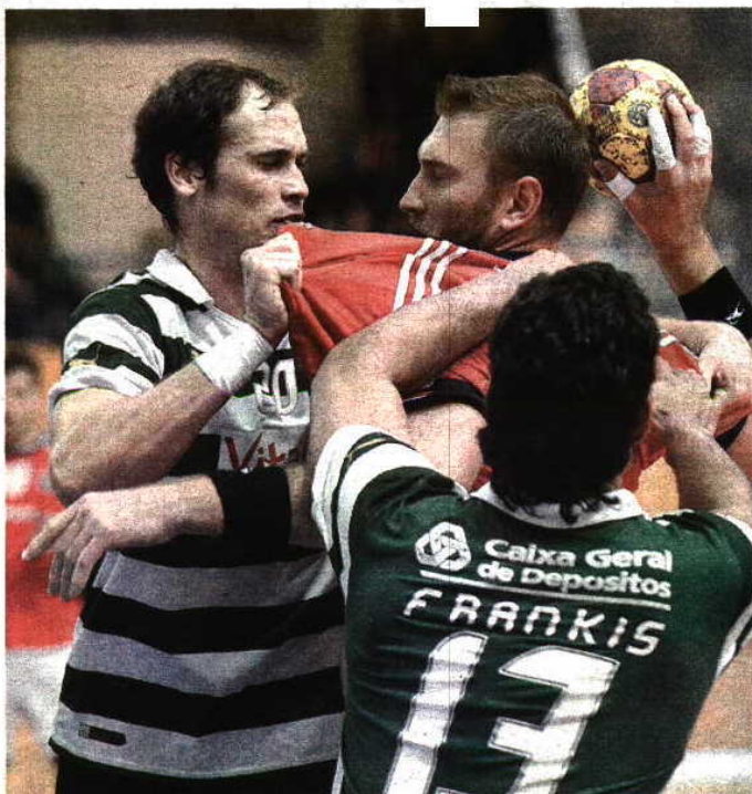
ESCALDANTE. Leões e águias prometem muita luta

Na edição da época passada, leões e águias também se cruzaram nas meias-finais (numa final-four disputada em Tavira), com triunfo do Sporting por 29-22, num encontro com um dado curioso: Ricardo Candéias, então guarda-redes do Benfica, defende agora as redes do conjunto leonino, enquanto Hugo Figueira, que era o guardião do Sporting, representa os encarnados.