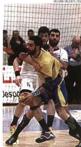
Duelo muito equilibrado