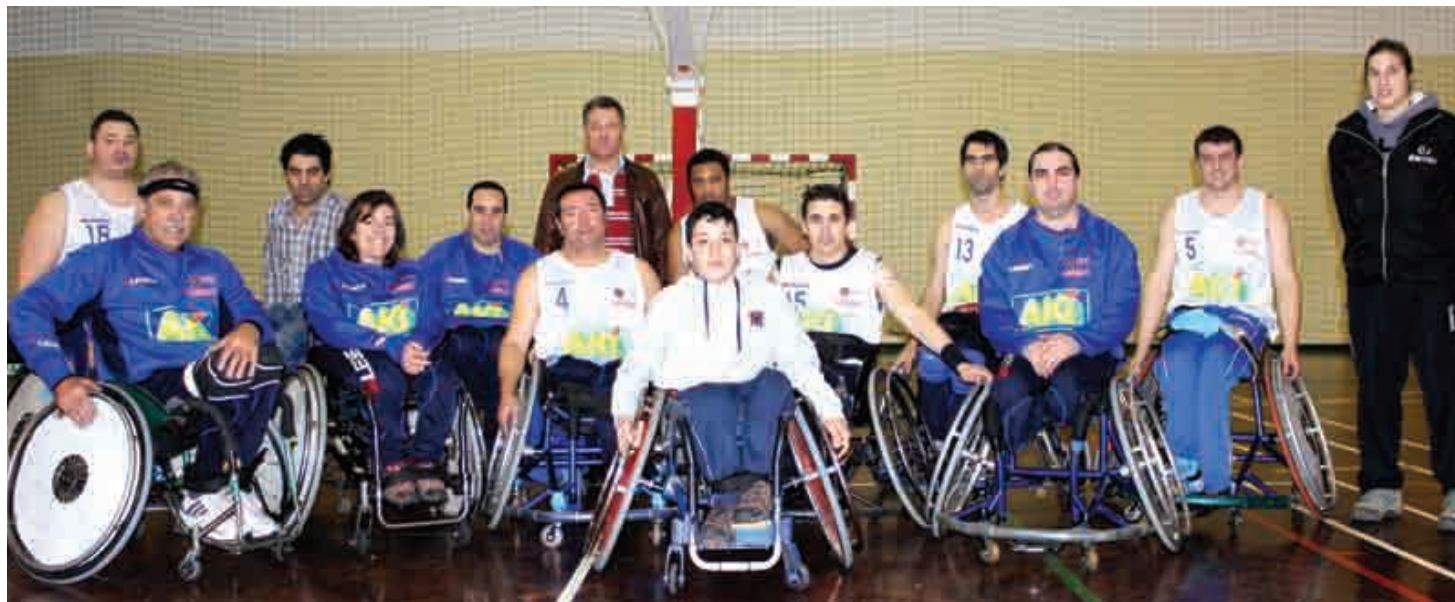
São estes os novos campeões nacionais de basquetebol em cadeira de rodas