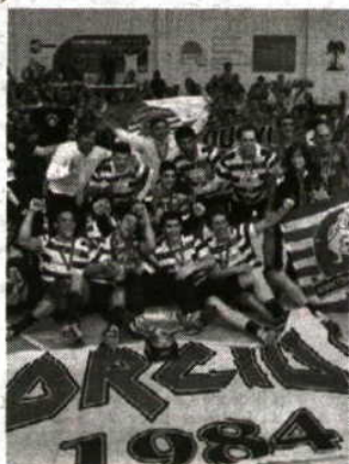
Leões bateram na final o ABC por 34-29

Na final da Taça feminina, também ontem realizada, o triunfo sorriu, pela 16ª vez consecutiva, ao Madeira SAD, que derrotou (36-29) o Alvarium. ■