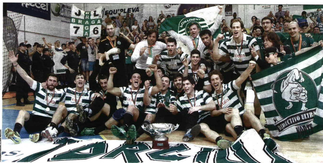
E vão três! Depois de duas finais ganhas ao campeão FC Porto, o Sporting festejou o tri não dando hipóteses ao ABC, recente líder do campeonato

15 são as Taças ganhas pelo Sporting, o dominador da prova