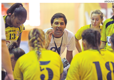
O treinador do Alavarium tem duas “baixas” de última hora

A preparação para um fim-de-semana, que se prevê carregado de emoções fortes fez-se... a “meio gás”. Condição com a lesão de duas atletas, que reduz o leque de opções ao dis-