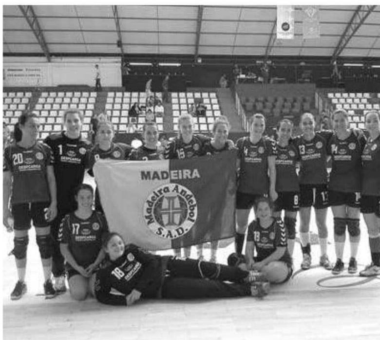
Madeirenses jogam a final com o Alavarium.

Depois de todos os problemas vindo a público esta semana no seio deste grupo de trabalho e no projecto, afinal os dirigentes também têm sofrido para 'colocar em