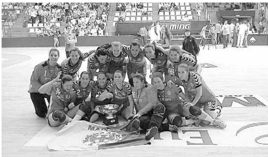
O Madeira Andebol SAD fez a festa de mais uma taça de Portugal.