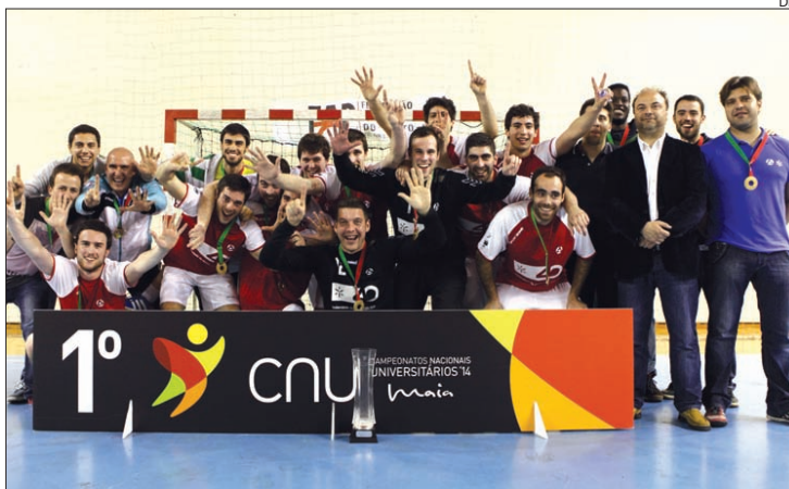
Andebol da AAUM em alta: sexto título consecutivo e seis anos sem perder

O futebol de 11 bateu, nas grandes penalidades, a UBI, e vão disputar a