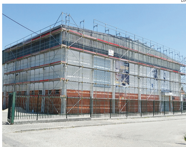
O pavilhão municipal Adelino Dias Costa entrou em obras

Estarreja Empreitada de beneficiação do recinto desportivo vai custar 124 mil euros