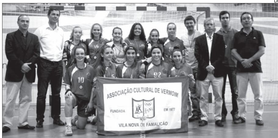
Equipa de Vermoim, vencedora do torneio

O primeiro torneio de andebol feminino “Terras de Vermoim” disputou-se no fim de semana no Pavilhão Municipal daquela freguesia de Vila Nova de Famalicão.