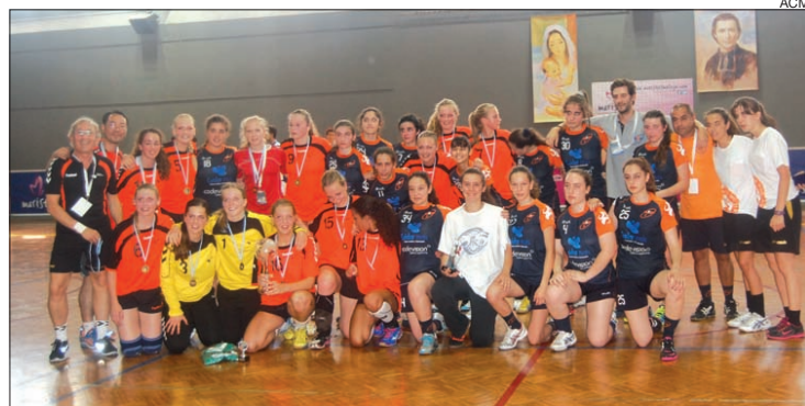
Equipa da Didáxis que competiu em Espanha

Sem tirar o mérito às adversárias mais diretas (seleção holandesa e BM Bera Bera) e mesmo com todas as atletas a poderem dar o seu contributo à equipa, a Didáxis conseguiu passar a fase de grupos na quarta posição tendo conseguido ir até às meias finais onde