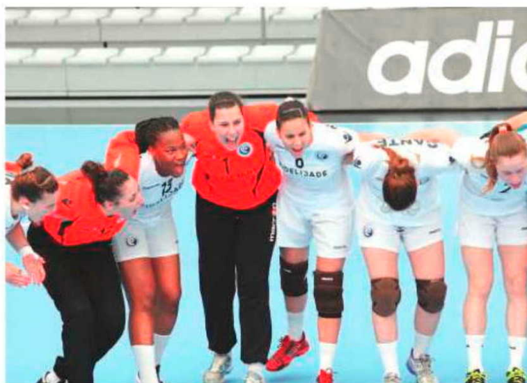
Madeirense (camisola n.º 1) esteve em destaque na baliza da selecção.