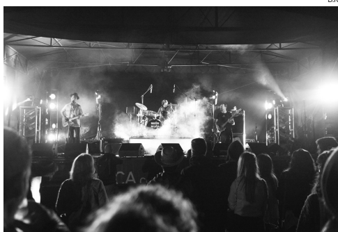
As quartas, sextas e sábados, acontecem espectáculos musicais

Nos dias 16 e 17, será promovido o Torneio de Andebol de Praia, no campo de jogos da Vagueira. No dia 23, dar-se-á início ao Torneio de Futebol de Praia; Será, também, nesse dia que desfilarão as Marchas Populares que envolvem mais de 700