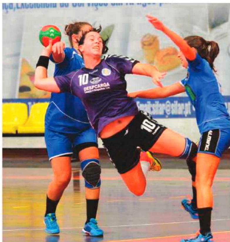
O Madeira SAD venceu como lhe competia o J. do Mar

Perto de surpreender o Colégio João Barros esteve o Sports da Madeira que também actuou no Funchal. As madeirense perderam por 28-26, com 16-12 ao intervalo favo-