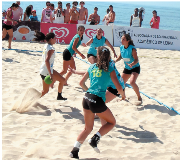
Andebol de praia é uma das sugestões dos centristas

POMBAL A Juventude Popular (JP) defende para a próxima época balnear a instalação de “infra-estruturas desportivas básicas” na praia do Osso da Baleia, única do concelho. A proposta foi enviada à Câmara Municipal, presidida pelo social-democrata Diogo Mateus, no último dia da época balnear.