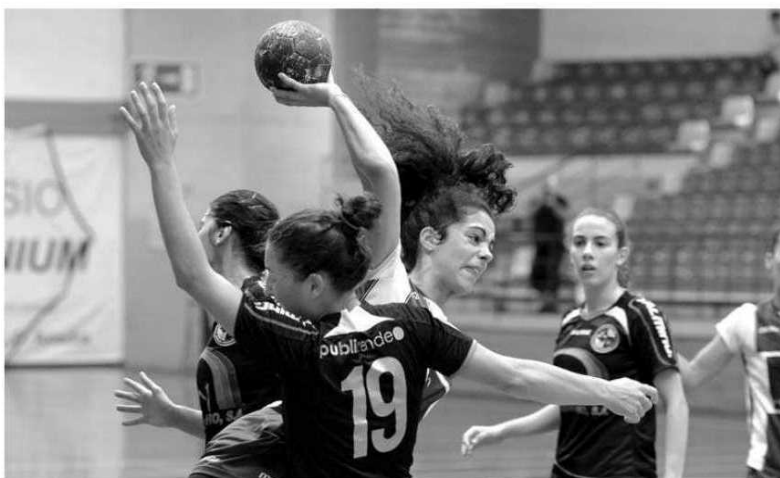
Sports bate Juventude do Mar por 28-23.

As madeirenses venceram por 28-23, com 12-11 ao intervalo também favorável ao Madeira. Um encontro equilibrado mas com a equipa da casa a ser mais eficaz na finalização com Sara Gonçalves em destaque obtendo com 10 golos. H.D.P.