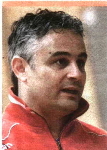
Seleção Nacional joga sexta e sábado