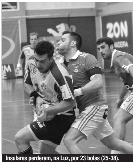
Insulares perderam, na Luz, por 23 bolas (25-38).

Na 2.ª jornada da fase final da 2.ª Divisão masculina, o Marítimo continua a vencer. On-