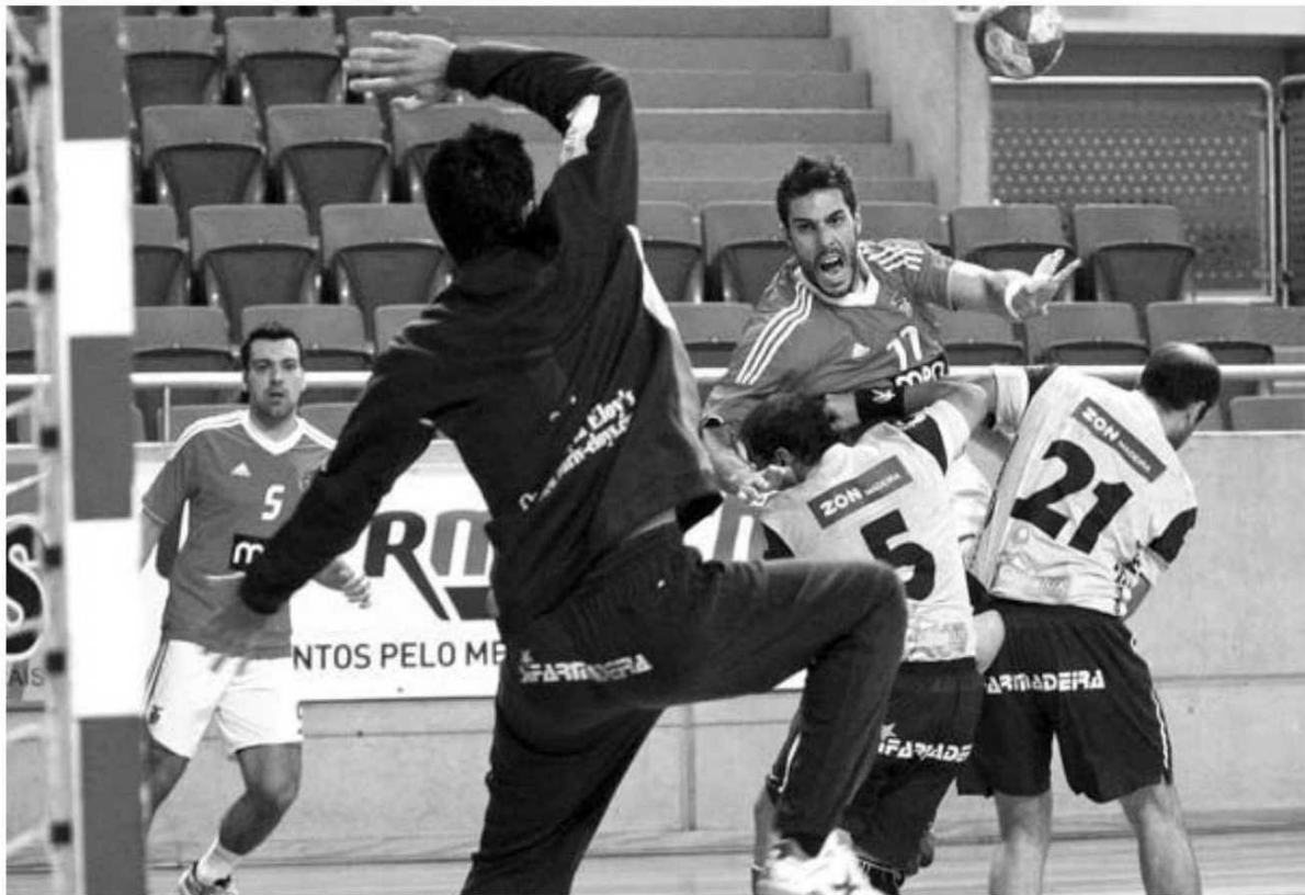
Os madeirenses, desta vez, não tiveram argumentos perante o Benfica