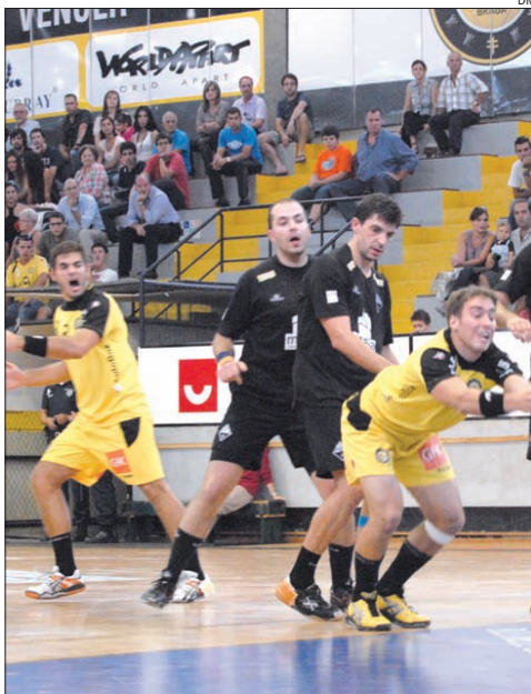
ABC joga novamente com Águas Santas

Depois de dois jogos em que a vitória sorriu à equipa maiata, o ABC de Braga quer, agora, «quebrar o enguiço».