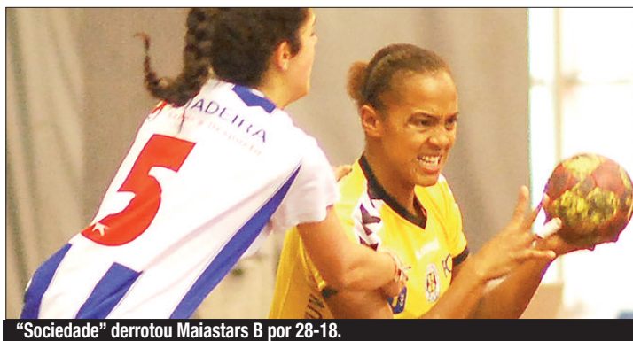
"Sociedade" derrotou Maiastars B por 28-18.

Antes, no 1.º jogo da tarde, o Sports da Madeira não teve dificuldades para derrotar o Leça, por