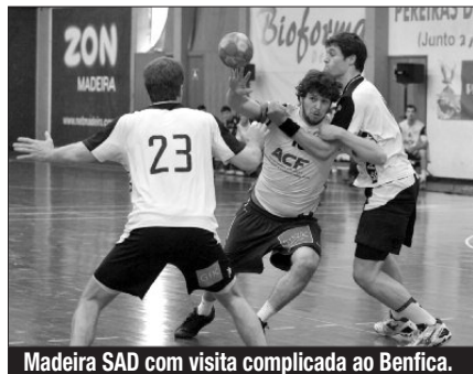
Madeira SAD com visita complicada ao Benfica.