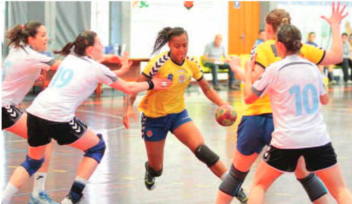
Madeira Andebol SAD e Sports da Madeira estiveram em alta neste fim-de-semana

HERBERTO D. PEREIRA desporto@dnoticias.pt