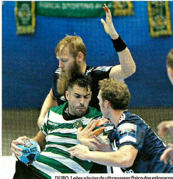
DURO. Leões vão ter de ultrapassar físico dos eslovacos

“Temos de estar contentes com a primeira volta que fizemos. Este jogo pode ser decisivo se ganharmos a um adversário direto. O que fizemos na Eslováquia não conta para nada. Vamos jogar em casa e espero que os nossos adeptos saiam de casa, independentemente de como estiver o tempo, pois precisamos de formar um arco-íris para termos um dia fantástico”, afirmou o treinador à SportingTV, realçando que o embate com os eslovacos adquire