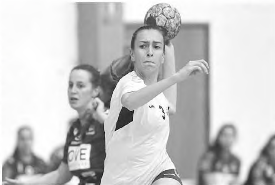
Madeirenses venceram sem grandes dificuldades.

Nos femininos, duas partidas onde a maior dificuldade para os emblemas da Região poderá surgir ao nível físico, isto depois da disputa de mais uma eliminatória da Taça de Portugal, com jogos reali-