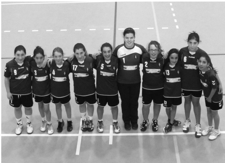
INFANTIS FEMININOS, que está a disputa o nacional da categoria

De realçar a presença, entre outras equipas, a "menina dos olhos" do clube, isto é a equipa de Infantis femininos, que está a competir no campeonato nacional da categoria, ocupando nesta altura um magnífico segundo lugar e com possibilidades de passar à fase de apuramento do campeão nacional deste escalão. AC