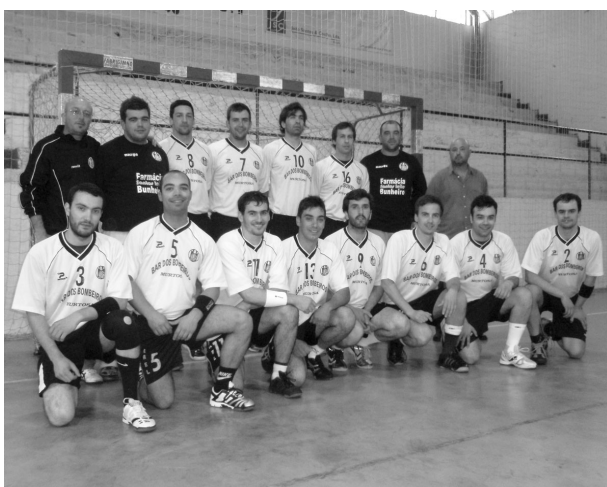
A EQUIPA DO MONTE ocupa agora a segunda posição da tabela

■ Num cenário de equilíbrio, dois candidatos à subida à Segunda Divisão nacional, Ílhavo e Monte proporcionaram um excelente