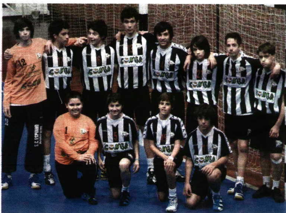
A equipa de andebol de iniciados A do Sporting Clube de Espinho que defrontou o ABC de Nelas