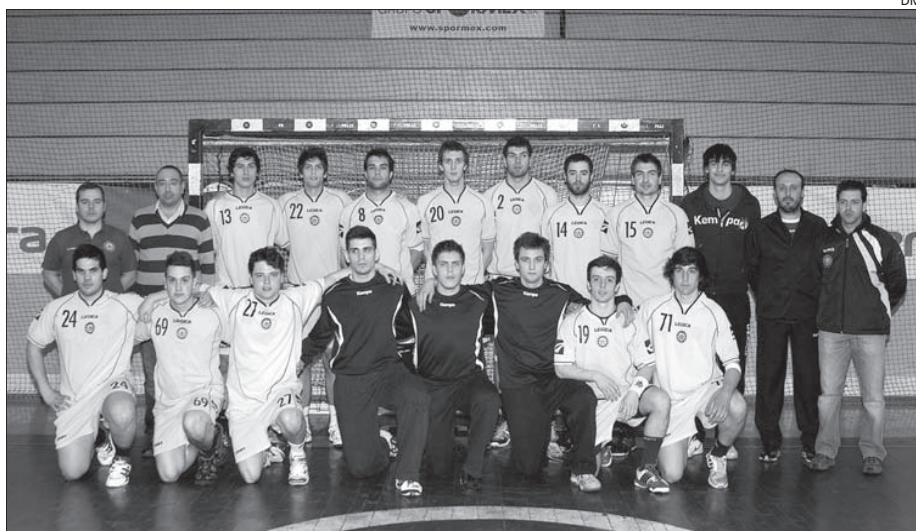
Equipa de juniores do ABC

A equipa de juniores do ABC de Braga é uma das oito que garantiram presença na fase final do campeonato nacional de andebol da categoria, cuja primeira fase terminou ontem, e da qual se sagrou vencedora, com mais um ponto que o FC Porto, que terminou na segunda posição.