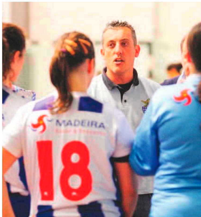
Equipas madeirenses com êxito na Taça de Portugal.

No campeonato nacional da I Divisão em juniores masculinos, a equipa do Marítimo foi ao reduto do Sporting sofrer uma pesada derrota por 45-25, um desfecho negativo para a equipa da Madeira.