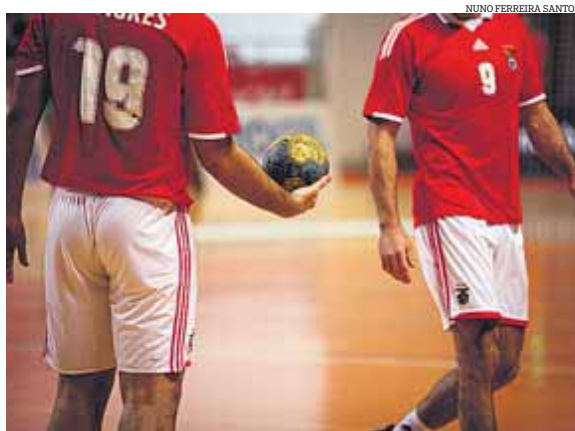
Os jogadores do Benfica deixaram fugir a vantagem nos últimos segundos