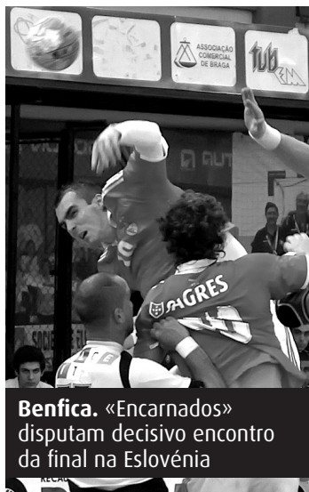
Benfica. «Encarnados» disputam decisivo encontro da final na Eslovénia

Depois de uns primeiros 20 minutos com os eslovenos a usufruírem de um ligeira ascendente, que nunca se traduziu em mais de um golo de diferença, o Benfica conseguiu impor-se finalmente nos últimos 10 minutos do primeiro tempo. Foi nessa altura que os «encarnados» chegaram a usufruir de uma vantagem de três golos, acabando o intervalo ainda com uma margem de dois para gerir.