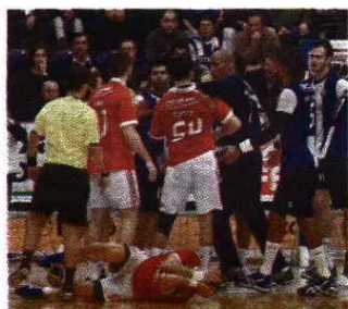
Confusão ➤ Jogo teve períodos quentes

Fez quatro golos em quatro tiros de meia distância, mas esteve longe de ser o mais influente. O destino acabou por o colocar no caminho da vitória portista, quando lhe coube o remate final a quatro segundos do fim. Acertou!