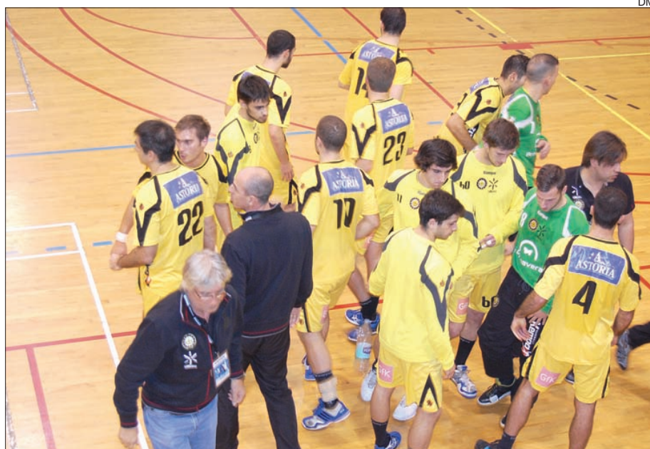
ABC/UMinho sentiu muitas dificuldades para vencer, extramuros, o AC Fafe

O ABC/UMinho venceu, ontem à tarde, extramuros, o AC Fafe, por 23-22, em partida relativa à 14. a jornada do Andebol 1.