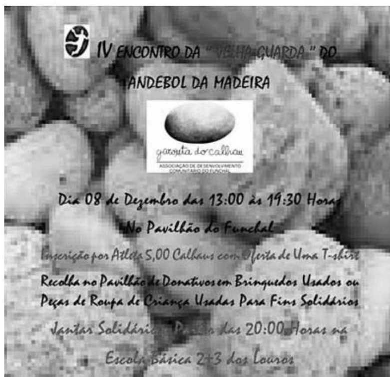
Evento solidário tem lugar no PAVilhão do Funchal.

Este torneio tem como objectivo angariar fundos para a instituição em causa. Cada jogador irá pagar 5 euros de inscrição, com direito a uma t-shirt e um calhau, revertendo parte desse valor a favor da 'Garouta do Calhau'. A organização conta já com várias