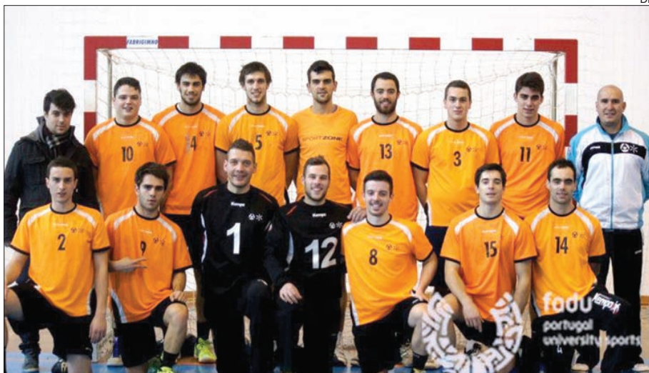
Equipa de andebol da Universidade do Minho

O sorteio ditou que no primeiro embate da fase de grupos os minhotos tivessem como adversários a equipa do IPViseu. O resultado final foi como seria de esperar um desequilibrado 19-7.