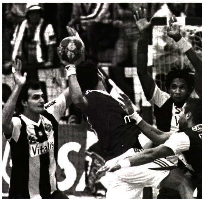
IMPENETRÁVEL. Benfica tem tido muitas dificuldades no Porto