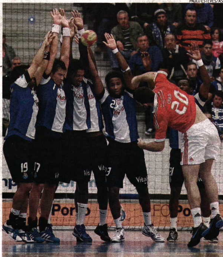
Dragões ergueram barreira intransponível entre os encarnados... e o triunfo!

Foi o epílogo de um jogo de loucos (ao qual nem a dupla de arbitragem leiriense Roberto e Daniel Martins, sentada na bancada, escapou, pois teve de mudar de local perante