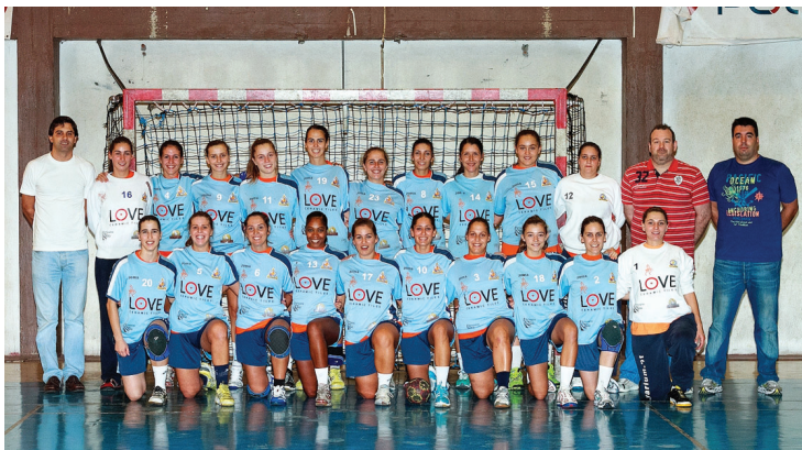
ALAVARIUM continua em grande destaque na 1.ª Divisão Feminina

Apesar da intempérie que se abateu sobre Aveiro no sábado, o público correu em bom número ao Pavilhão do Alavarium e, desde cedo, se entusiasmou com a prestação da equipa da casa, que, com uma defesa agressiva, asfixiava o ataque das gaienses e permitia contra-ataques rapidíssimos. A treinadora do Colégio de Gaia uti-