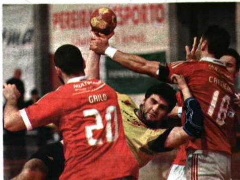
QUEDA. Madeira SAD não escapa aos problemas