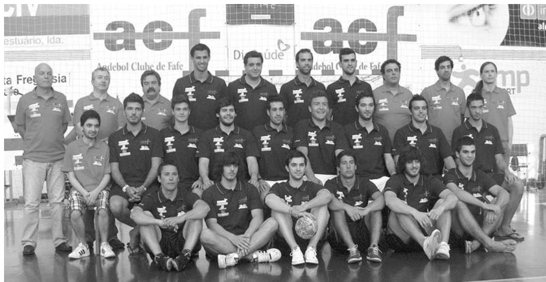
Plantel do AC Fafe apresentou-se ontem para a nova temporada, visando a participação no campeonato nacional da I divisão