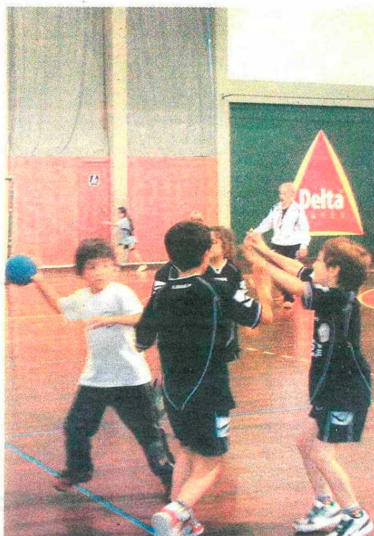
16 equipas marcaram presença na primeira prova do Andebol Kids.

No que diz respeito ao Torneio de Abertura também estão marcados alguns fortes duelos na conquista pelo primeiro título da época.