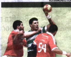
Leões triunfaram em casa

➔ O Sporting venceu ontem o Benfica por 28-25, em Odivelas. As águias lideram o grupo A da Fase Final, mas os leões perturbaram a luta do Benfica com o segundo classificado FC Porto, que pode aproximar-se. [Ver página 35]