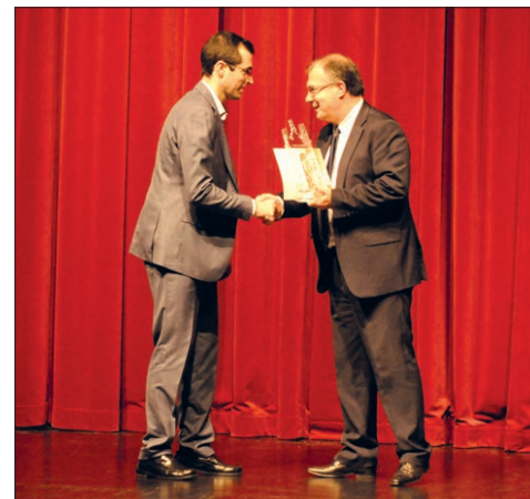
Diretor do Diário do Minho entregou prémio ao árbitro