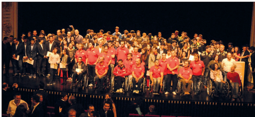
Os galardoados da II Gala do Desporto de Braga