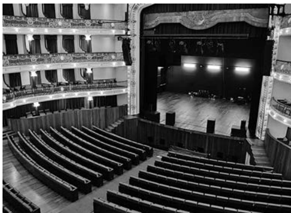
Sala do Theatro Circo é o palco da II edição da Gala do Desporto do Município de Braga

No total, são cerca de 70 os galardões que a Câmara Municipal de Braga vai entregar nesta II Gala do Desporto, evento que reconhece o trabalho de todos os campeões nacionais e também medalhados internacionais em 2015.