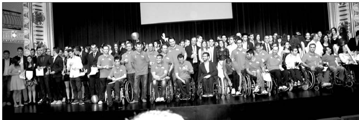
Os distinguidos na I Gala, realizada em 2014

A II Gala do Desporto de Braga realiza-se hoje, a partir das 21h00, no Teatro Circo, e vai premiar várias dezenas de atletas que, ao longo do último ano se evidenciaram nas respetivas modalidades.