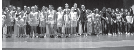
O espectáculo Dan`Cem Todos