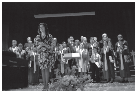
O espectáculo Vocalidades