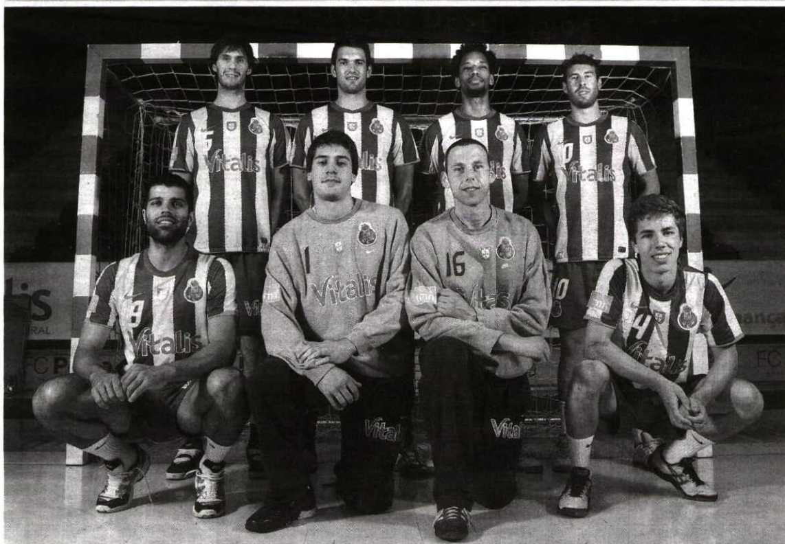
A equipa tricampeã de andebol tem seis jogadores oriundos das camadas jovens. O F.C. Porto começa a ser uma fábrica de campeões também no andebol