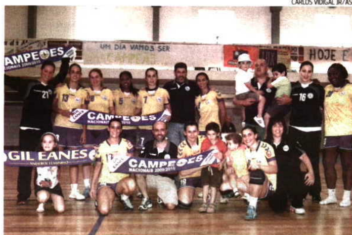
Jogadoras e técnicos do Gil Eanes fizeram em casa a festa do bicampeonato

O Gil Eanes revalidou o título de campeão nacional de andebol feminino, ao bater ontem o Madeira SAD, por 27-23. Num encontro em que o empate bastava às algarvias, a primeira parte acabou por revelar-se algo complicada para as anfitriãs, que saíram para o intervalo a perder por quatro golos, 13-17. A diferença esteve na atitude defensiva das equipas — a madeirense agressiva em 5x1 e a não permitir muitas situações de finalização às algarvias, que também não tiveram eficácia, pois foram várias as situações em que conseguiam furar o muro madeirense, mas a falta de pontaria foi evidente, com três remates aos postes e outros que nem na baliza acertaram.