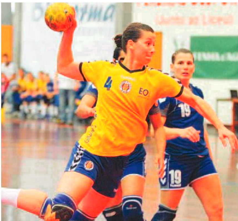
As madeirenses pelo segundo ano consecutivo ficam-se pelo 2º lugar.

Ontem, a primeira parte foi toda comandada pelas madeirenses que se apresentaram disposta em 'estragnar' e adiar a festa da equipa da