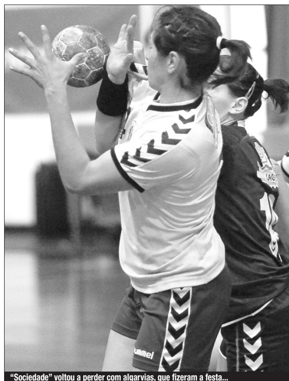
"Sociedade" voltou a perder com algarvias, que fizeram a festa...