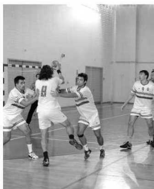
Marienses joga amanhã