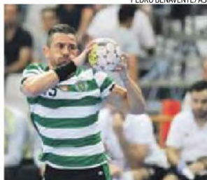
Campeão Sporting já lidera o campeonato