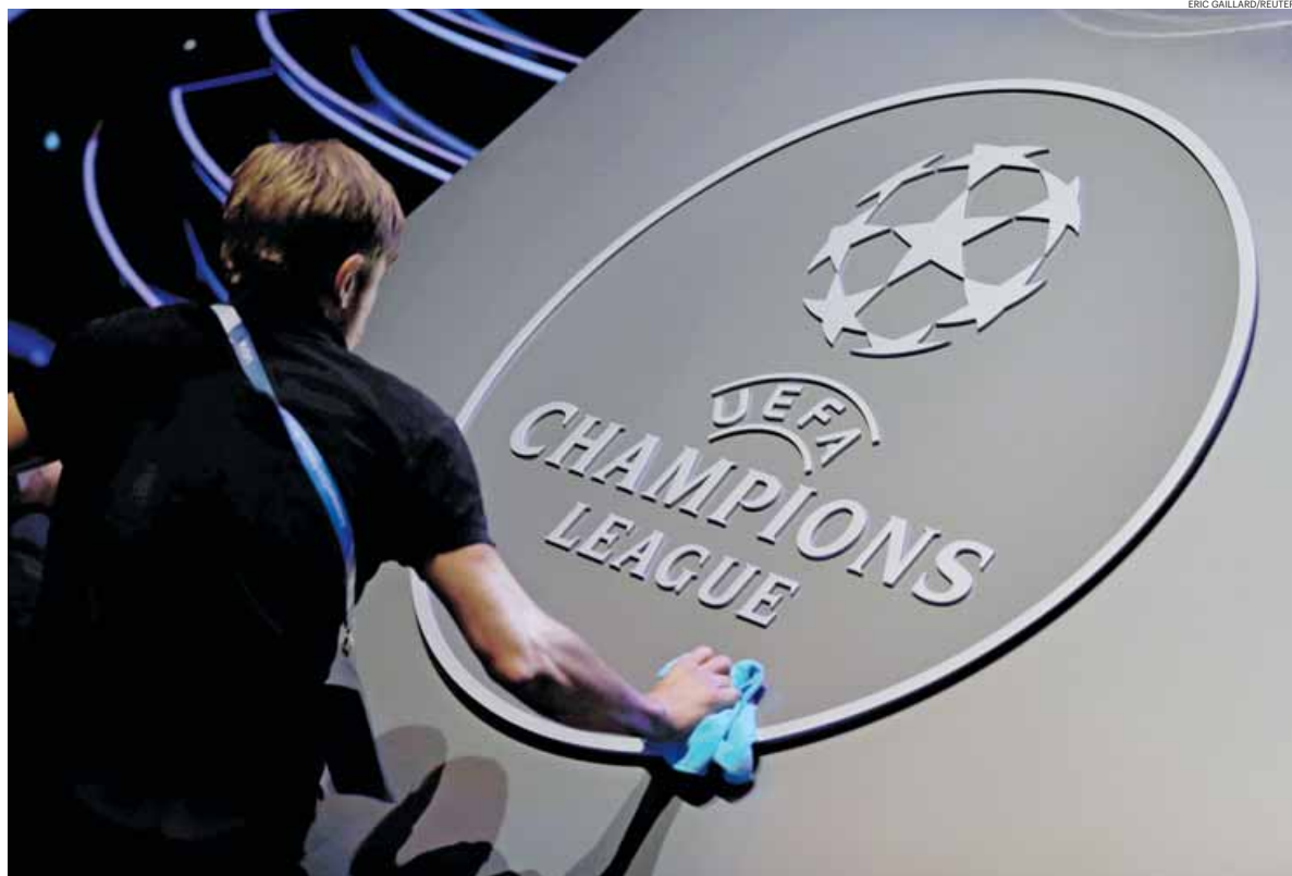
A Liga dos Campeões vai manter o formato e o número de participantes inalterado

O futebol irá seguir, assim, o modelo de outras modalidades colectivas na Europa, como o voleibol (Taça Challenge, CEV Cup e Liga dos Campeões) ou o andebol, que tem também três competições de clubes, a Liga dos Campeões, a Taça EHF e a Taça Challenge, cujos participantes são ordenados de acordo com o ranking de cada liga.