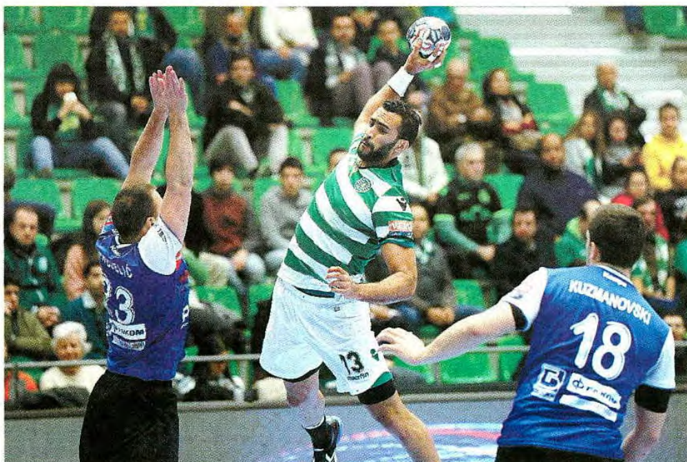
Sporting já defrontou o Metalurg na temporada passada para a Liga dos Campeões