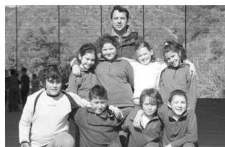
Externato da Sagrada Família.