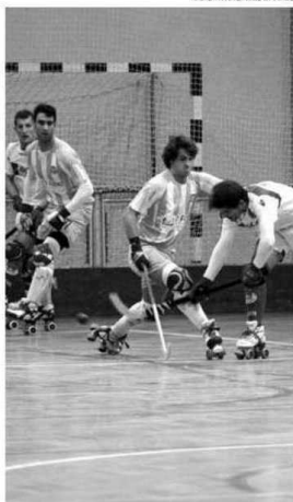
Marítimo recebe o Campo Ourique