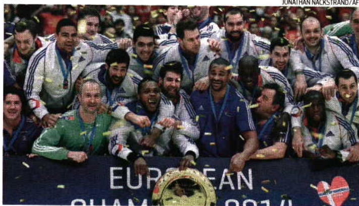
A França conquistou o terceiro título de campeã europeia de andebol depois de 2006 e 2010

Os Experts deixaram claro que o 11. o lugar no Europeu da Sérvia-12 foi uma escorregadela num caminho em que somou oito medalhas de ouro desde 2000. Nikola Karabatic foi eleito o MVP do Europeu da Dinamarca, seleção que passou o testemunho à Polónia. Espanha ficou com o bronze, após derrotar a Croácia por 29-28. E. D.