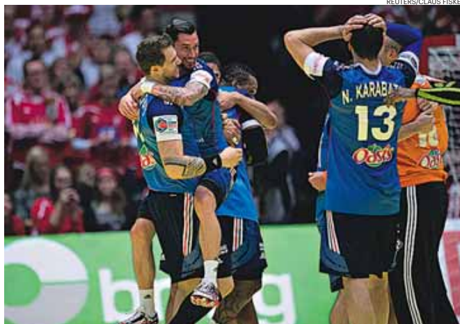
A festa francesa na Dinamarca, que junta o título europeu ao olímpico