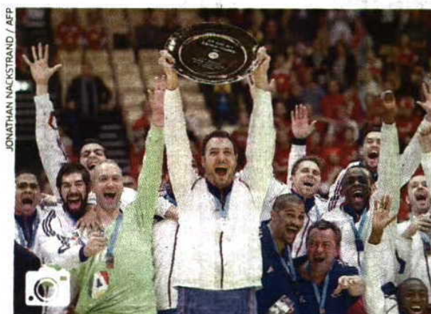
ANDEBOL FRANÇA SAGRA-SE CAMPEÃ EUROPEIA A França venceu a Dinamarca (41-32) e sagrou-se campeã europeia pela terceira vez na história. O triunfo aconteceu em casa do adversário, que era o detentor do título.