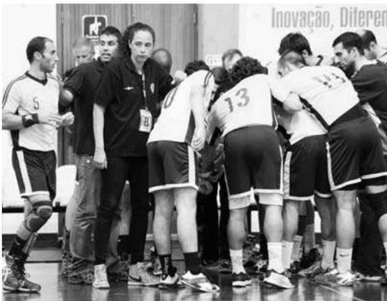
Madeira SAD masculino recebe o campeão FC Porto.

No domingo, o Madeira Andebol SAD volta à carga agora para um desafio certamente bem 'mais à mão'. A formação da Região recebe