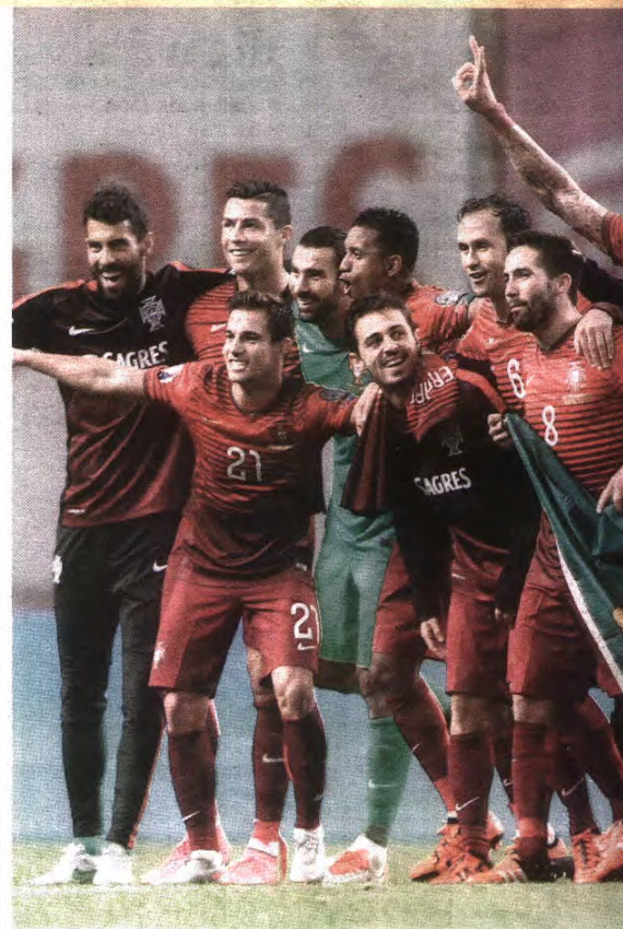
Um grupo vitorioso, com Fernando Santos ao comando, não esconde a ambição de ser feliz no Euro