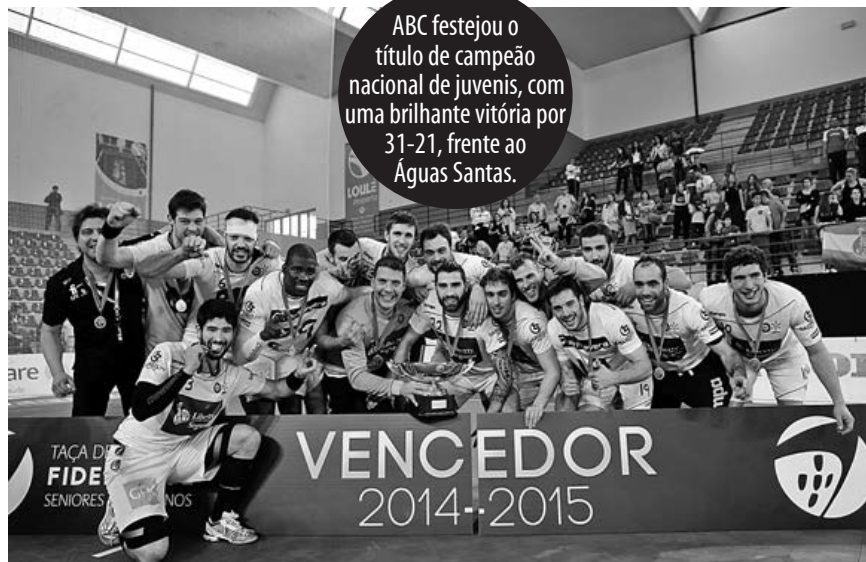
ABC/UMinho conquistou a Taça de Portugal de andebol e marcou presença na final da Taça Challenge, na Roménia

Mas o momento alto do ano foi a presença na final da Taça Challenge de andebol. Na Roménia, frente ao Odorhei, o ABC/UMinho falhou a oportunidade de conquistar o troféu europeu ao perder por 32-25, depois do triunfo em Braga, por 32-28. Foi a terceira final europeia dos académistas.