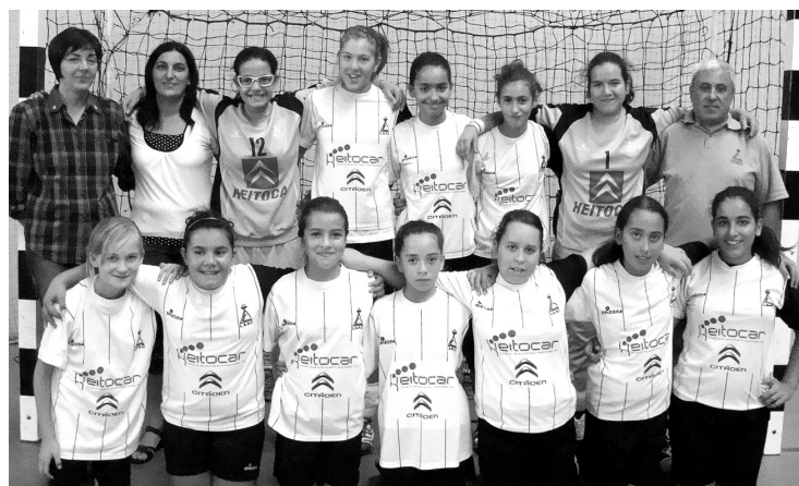
Iniciadas da LAAC