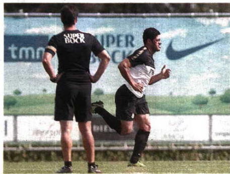
MAIS UM. Mais-valia do Incrível enquadrada na equipa

A janela de transferências fecha hoje na maioria dos campeonatos, mas há países nos quais se prolonga por mais alguns dias. São esses os casos da França e da Rússia, por exemplo, que só encerram nos dias 4 e 6 de setembro, respetivamente. Questionado sobre a possibilidade de alguns clubes dessas ligas ainda tentarem mexer com a composição do seu grupo, Vítor Pereira encolheu os ombros. "Não me preocupa minimamente. As regras do mercado são essas e eu não as posso mudar, por isso..."