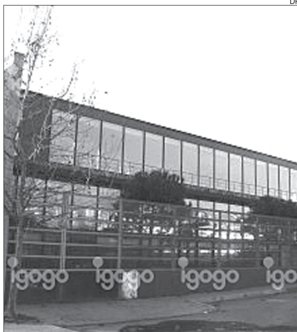
Multiusos de Fafe recebe supertaça em andebol

Já o FC Porto é o campeão em título e vai tentar levantar mais um troféu no andebol nacional, agora em terras minhotas.