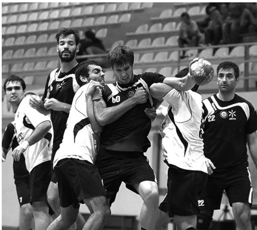
ARTÍSTICA aguentou bem com o poderoso ABC