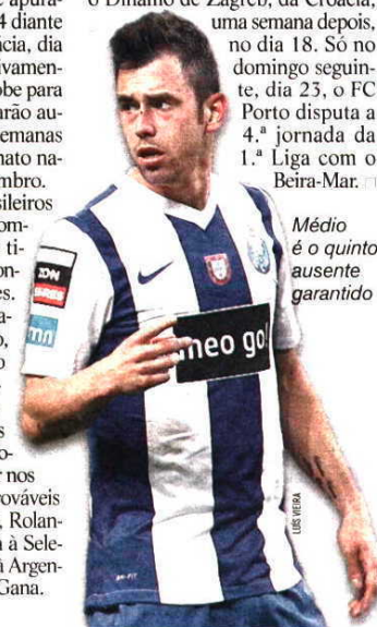
Médio é o quinto ausente garantido

Note-se que a estreia do FC Porto na atual edição da Champions vai acontecer na sequência dos jogos internacionais. As seleções jogam as suas segundas partidas deste período no dia 11 e os dragões enfrentam o Dinamo de Zagreb, da Croácia, uma semana depois, no dia 18. Só no domingo seguinte, dia 23, o FC Porto disputa a 4.ª jornada da 1.ª Liga com o Beira-Mar.