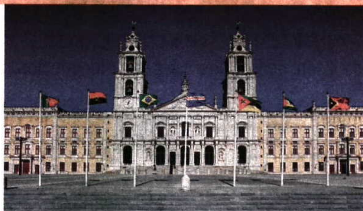
Frente ao Convento de Mafra as bandeiras das nações participantes nos Jogos da CPLP

Assim, os Jogos da CPLP contam com atletas de sete países — Portugal, Angola, Brasil, Cabo Verde, Moçambique, São Tomé e Príncipe e Timor Leste —, a competirem em igual número de modalidades — atletismo, atletismo para pessoas com deficiência, ténis, voleibol de praia (todos em masculinos e femininos), andebol masculino, basquetebol feminino e futebol masculino. A prova destina-se a atletas sub-16, com exceção das provas para deficientes (sub-20) e o voleibol de