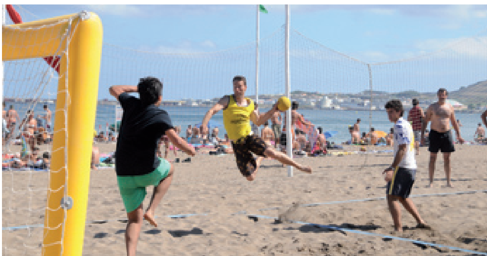
ANDEBOL DE PRAIA promete animar o verão na cidade de Vitorino Nemésio

I PraiAndebol 2012, dia oito de julho, 15:00. II PraiAndebol