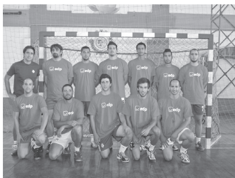
PLANTEL – Vitória aposta na manutenção mas espreita Fase Final

A lembrança que os vitorianos têm da sua estreia, a época transacta, no Campeonato Nacional da II Divisão, não é grata, uma vez que perderam no Funchal, com o Marítimo, por números muito vultuosos, mesmo que na