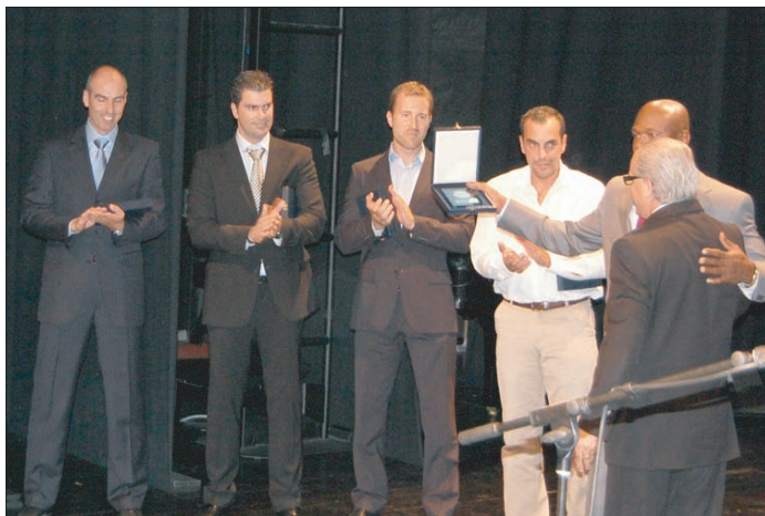
Alguns dos atletas homenageados na Gala em Fafe

cer o mérito de muitas pessoas que deram muito ao andebol. Queríamos que isto fosse uma semana de Andebol desde a competição à recreação. O futuro passa por uma grande interacção com o desporto escolar e com o movimento associativo. O distrito de Braga continua a ser um dos expoentes da qualidade do nosso andebol. Estamos a alargar a base a outros concelhos com