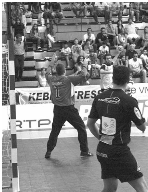
ABC de Braga foi derrotado pelo Sporting

equipa bracarense também demonstrou algumas lacunas, principalmente no capítulo das transições, onde não soube tirar