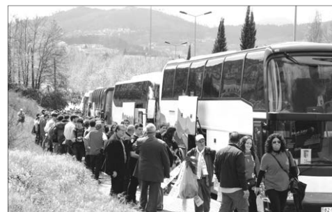
Adeptos do SC Braga já reservaram 70 autocarros

Os cerca de 12 mil bilhetes reservados aos sócios braguistas foram todos vendidos e, por isso, espera-se que, nos próximos dias, aumentem as inscrições no GNRation, onde os adeptos, desde que munidos do retângulo mágico que dá acesso ao jogo com os leões, podem inscrever-se para, assim, usufruírem de transporte grátis para a final da Taça de Portugal, aprazada para 31 deste mês, no Vale do Jamor.