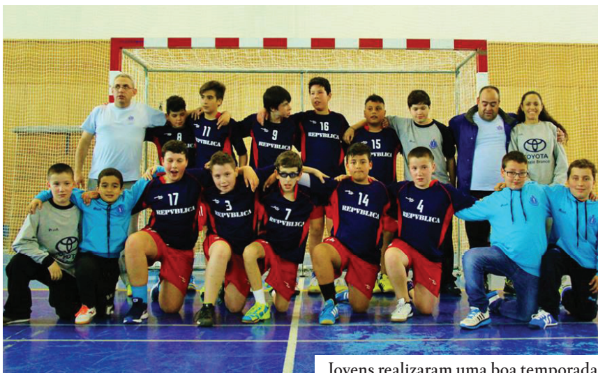
Jovens realizaram uma boa temporada