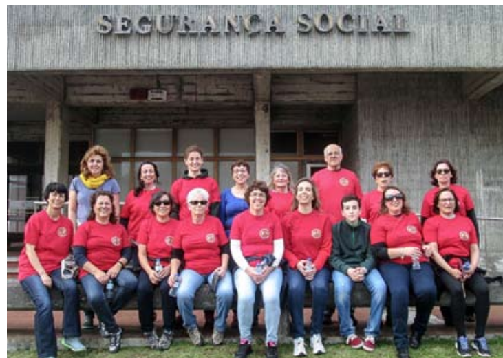
GRUPO DE PARTICIPANTES na Caminhada promovida pela Segurança Social

O modelo organizativo é idêntico ao do ano transato, sendo constituído por cerca de 20 estações com atividades lúdicas/desportivas. Para além das modalidades descritas, incluir-se-ão jogos tradicionais, circuito de destrezas, bicicletas, escalada, insufláveis, matraquilhos e taurina-pegas. Mais informações sobre este acontecimento em próximas edições.