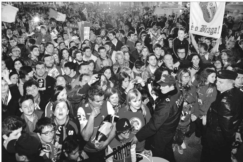
Praça do Município será uma espécie de "mini-Jamor"