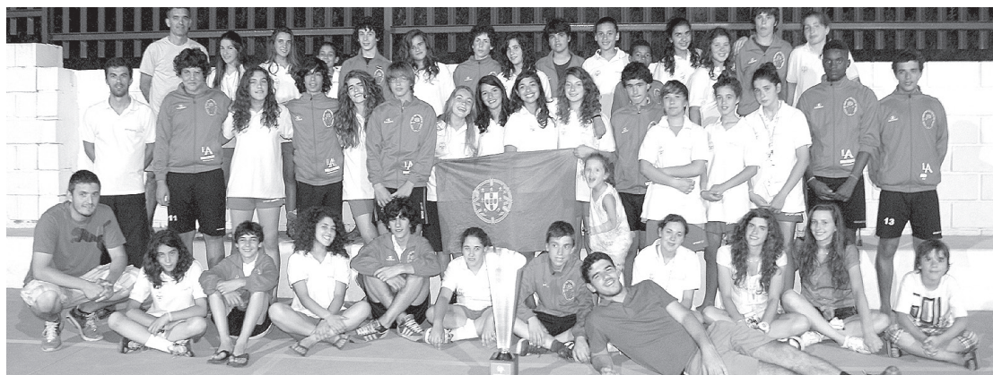
Os atletas do Valongo do Vouga que estiveram em Espanha

Formação valonguense, campeã nacional em título, superou melhor equipa do país vizinho