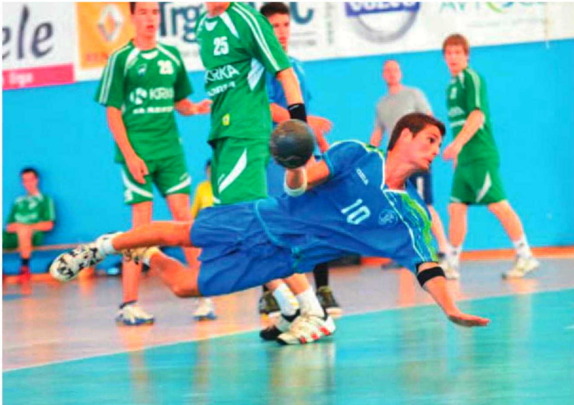
Os madeirenses deram espectáculo e surpreenderam.