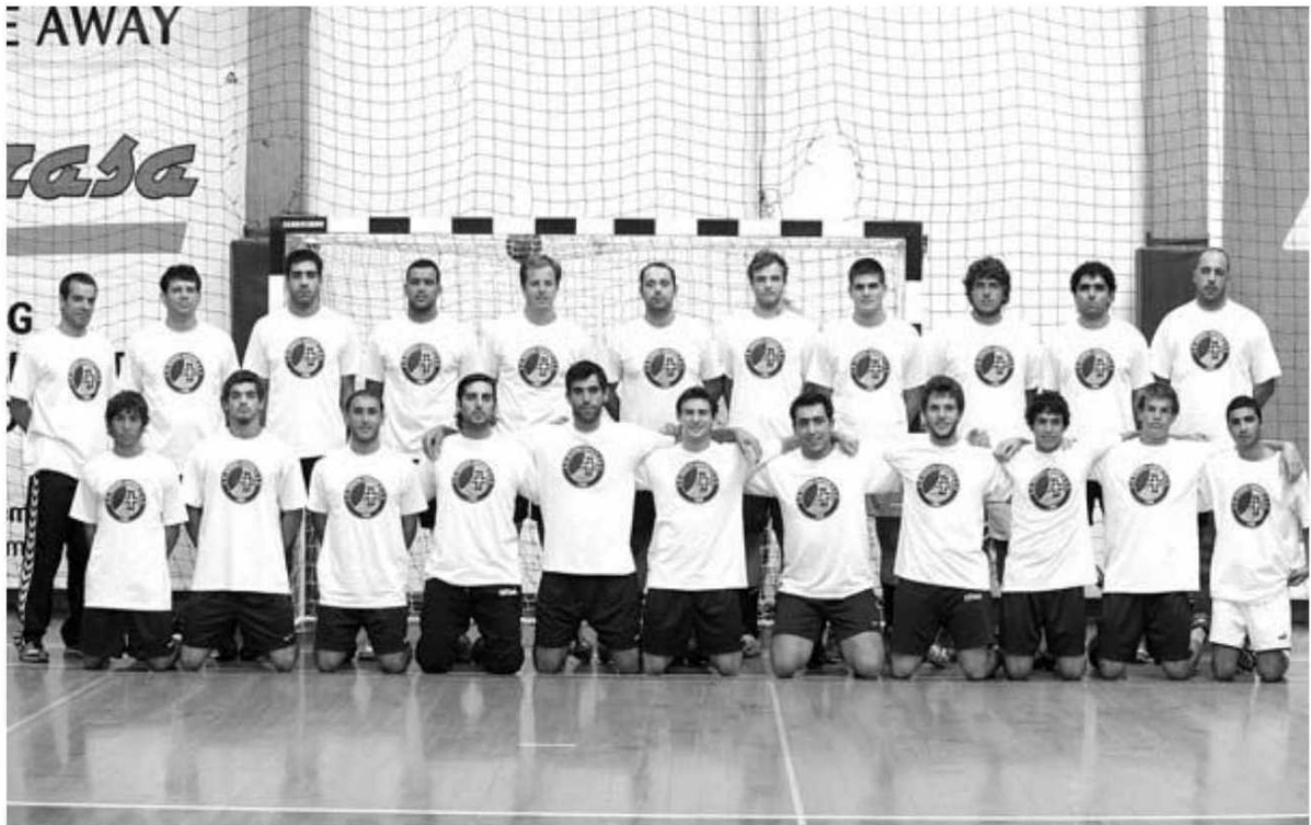
Os madeirenses necessitam de 11 mil euros para confirmar a sua participação na I Divisão de andebol.