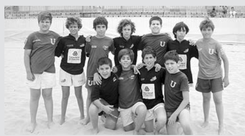
Jovens craques do Rêguebi de Viana mostraram o seu valor

O Rêguebi de Viana encontra-se a disputar, com três equipas (duas no escalão sub-14 e uma sub-12), no Circuito Beach-Rugby ARN/ FPR, tendo disputado, no passado fim-de-semana, em Matosinhos na primeira jornada da competição, tendo conseguido bons resultados apesar da sua inexperiência.