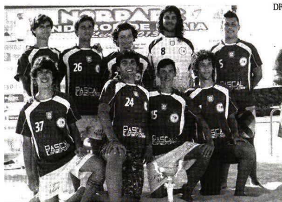
Nazarenos do TÁTASI TEAM querem renovar o título nacional de ROOKIES

A equipa nazarena de andebol de praia "Tátasi Team", venceu a "II Etapa