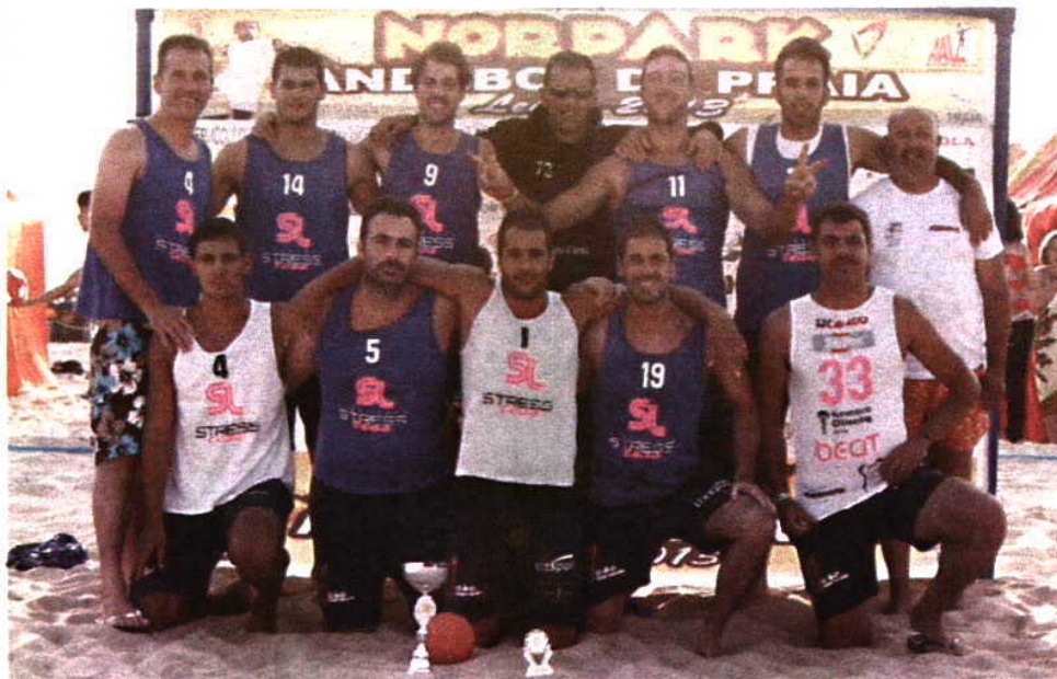
Raccoons D'Areia sagraram-se campeões regionais na praia de Paredes

A praia de Paredes da Vitória, no concelho de Alcobaça, engalanou-se para receber a IV etapa de andebol de praia da Associação de Andebol de Leiria.