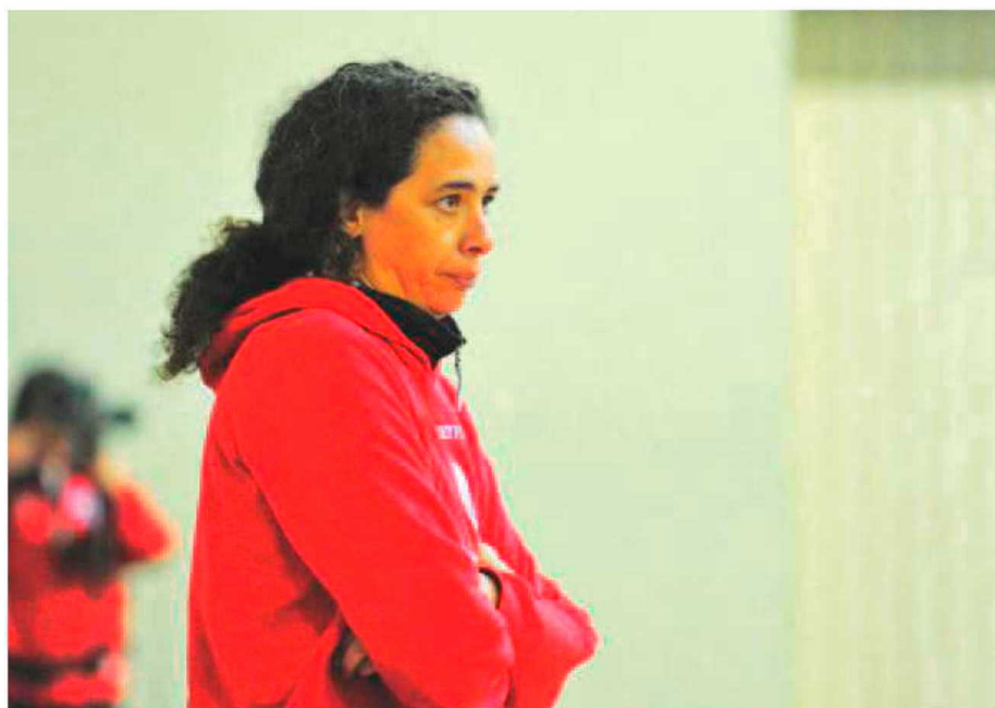
Directora técnica da AAM está de consciência tranquila e diz que esteve sempre na AAM de corpo e coração.