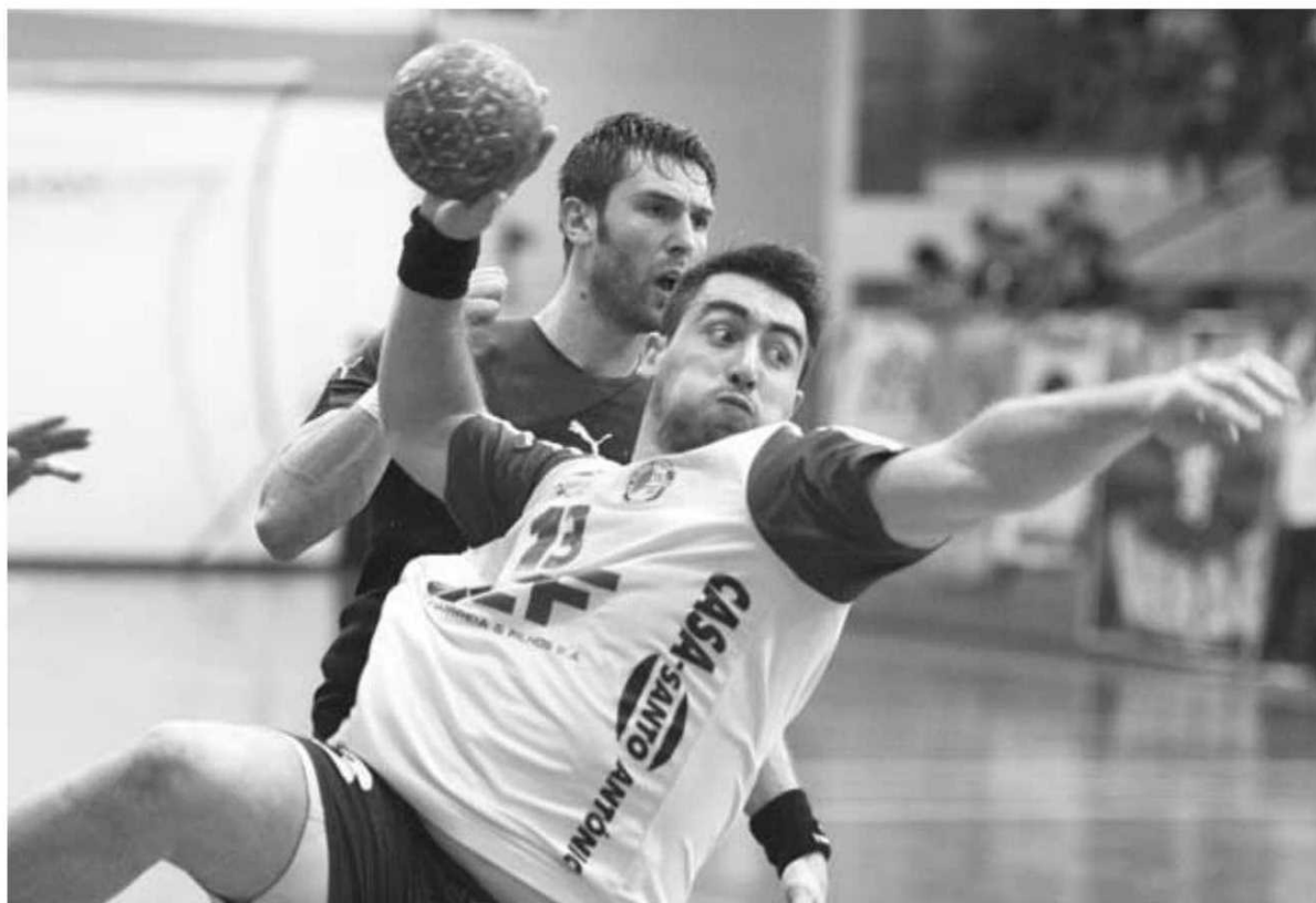
O Madeira Andebol voltou a ganhar uma das grandes equipas do campeonato nacional.