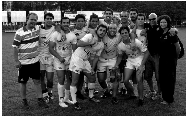
EQUIPA MASCULINA (que é campeã europeia) dominou como quis e garantiu o quarto título seguido