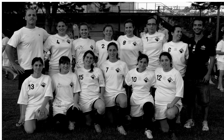
EQUIPA FEMININA foi implacável e derrotou todas as adversárias de forma expressiva (a zero!)

Recorde-se que a Académica sagrou-se campeã europeia em Julho passado e, segundo o "capitão" academista, este ano pode ser possível repetir o sonho: «Temos equipa para estar no "Europeu" e ganhar outra vez».