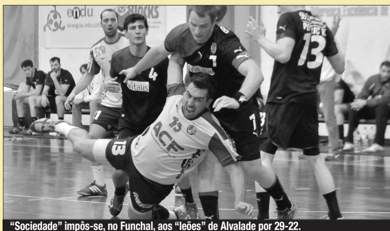
"Sociedade" impôs-se, no Funchal, aos "leões" de Alvalade por 29-22.