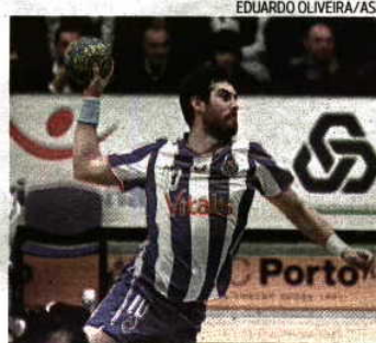
FC Porto já ganhava por 10 ao intervalo