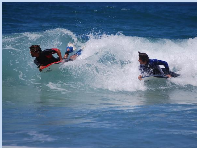
PLAYA "LA CALA DE MIJAS"