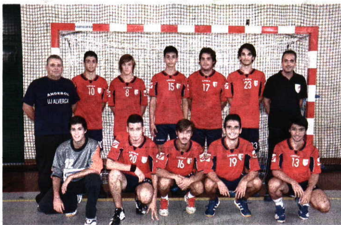
ANDEBOL. Plantel sénior conta para já com dez inscritos mas o clube espera inscrever 18