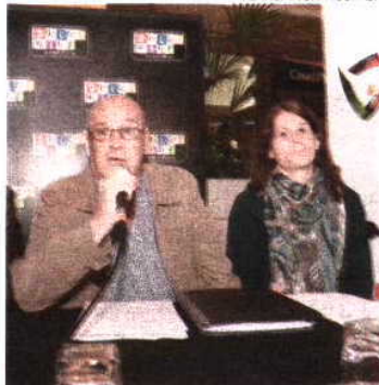
Campanha portuguesa apresentada ontem

concentram em Almada até dia 22, altura em que partem para a República Checa. O regresso a Coimbra é a 24 de outubro. H. C.