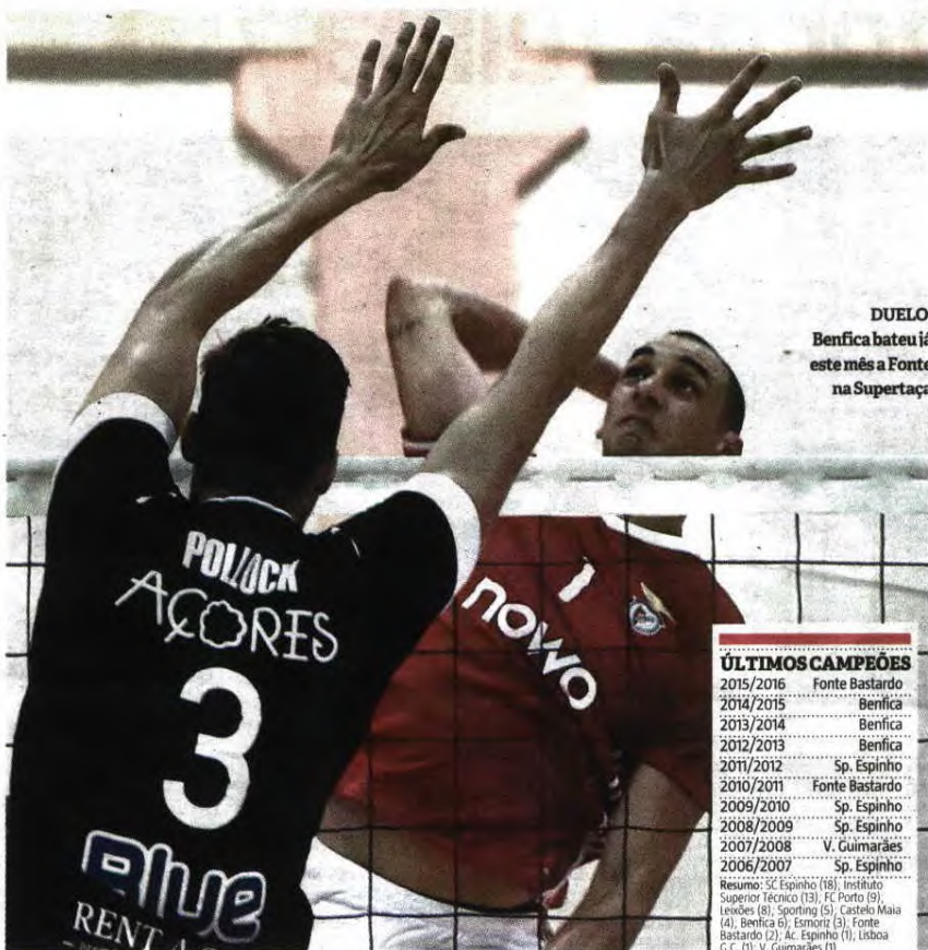
DUELO. Benfica bateu já este mês a Fonte na Supertaça