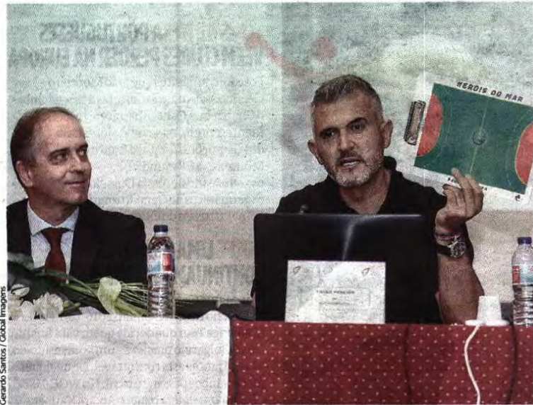
Gerardo Santos / Global Images