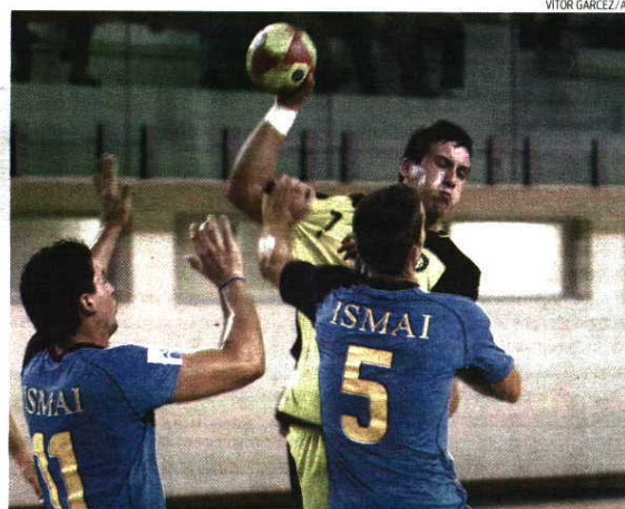
Primeira linha do ABC tratou de colocar equipa em vantagem ainda na primeira parte