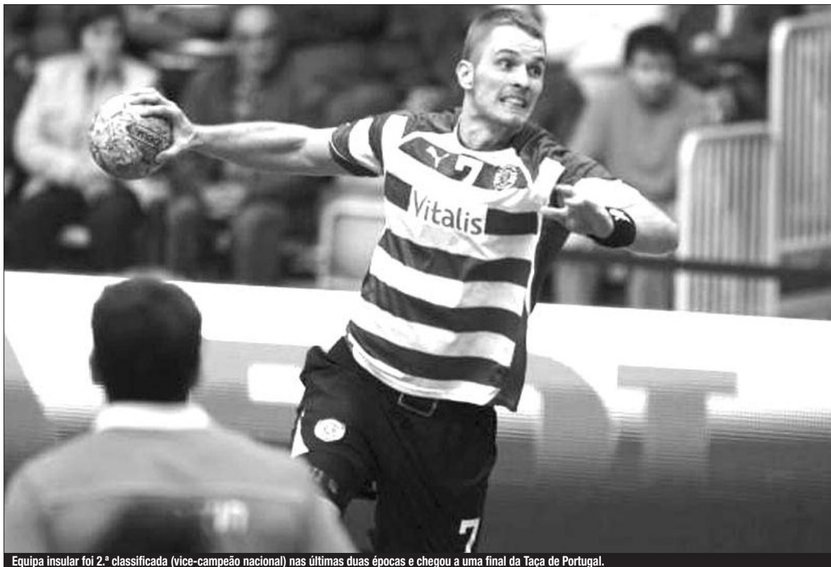
Equipa insular foi 2.ª classificada (vice-campeão nacional) nas últimas duas épocas e chegou a uma final da Taça de Portugal.

■ ANDEBOL - INTERNACIONAL PORTUGUÊS É REFORÇO DE QUALIDADE PARA O MADEIRA SAD