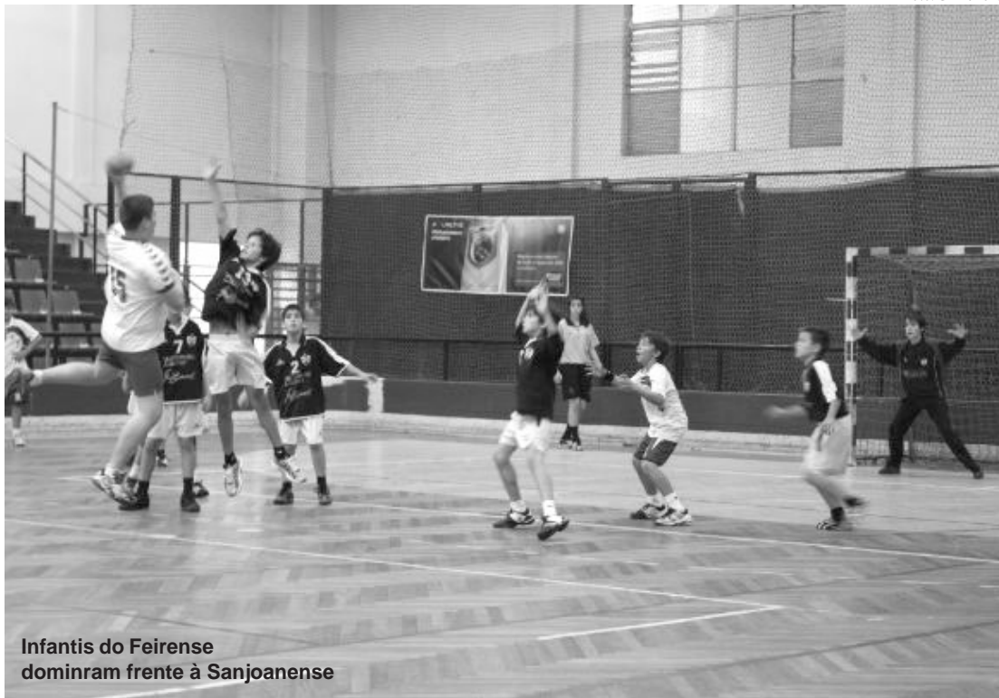
Infantis do Feirense dominam frente à Sanjoanense

Equipa de Infantis do Feirense venceu a Sanjoanense e continua na luta pelo primeiro lugar do grupo de apuramento. Iniciados venceram em Penafiel e os Minis deram espectáculo na Lavandeira.