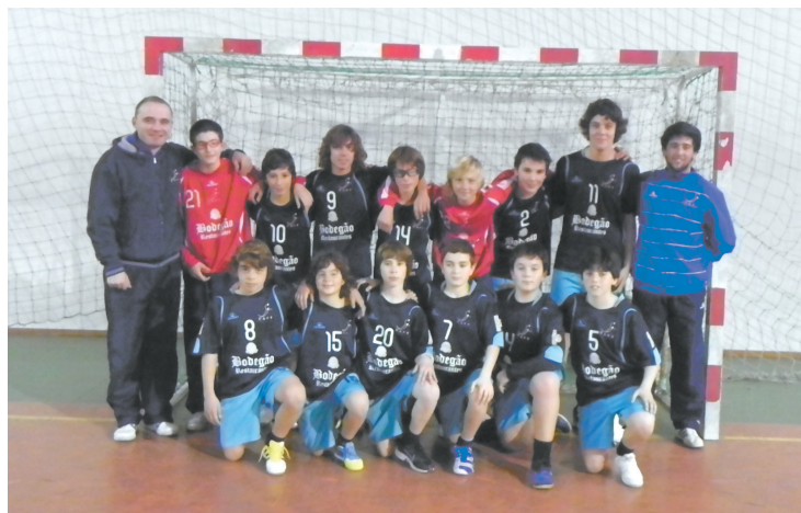
As equipas do Clube de Andebol da Póvoa - Infantis