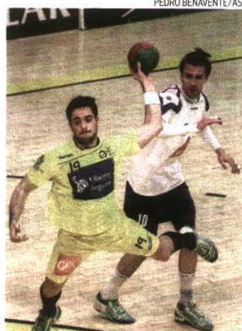
Equipa de Braga foi superior desde o início

reentrou no jogo. Ao intervalo, já perdia por 24-13.