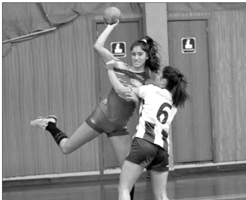
Foi um fim de semana de imensa atividade no andebol regional.

Nos juvenis femininos, o CD Bartolomeu Perestrelo empatou a 20 golos com o Madeira A, num jogo de grande intensidade e nervosismo onde a equipa da casa esteve quase sempre na frente do marcador, no entanto o Madeira A conseguiu recuperar nos instantes finais ditando o resultado final.