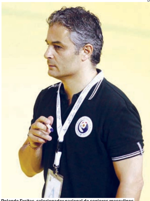
Rolando Freitas, selecionador nacional de seniores masculinos

Já houve melhores dias para o andebol na região, mas Rolando Freitas acredita que é possível dar a volta: “O Andebol é uma modalidade que está em franco crescimento, a segunda modalidade com maior número de praticantes, e acre-