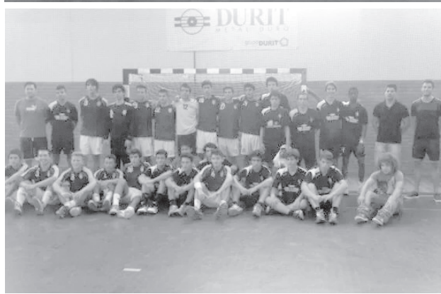
As equipas de iniciados e de juvenis do Feirense.