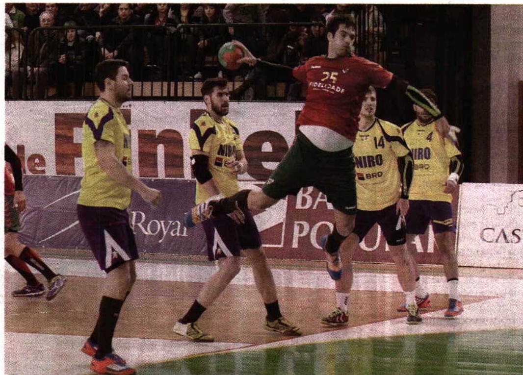
Miguel Pereira da Silva / Global Images

No primeiro tempo, Portugal entrou melhor e conseguiu que a Roménia só marcasse por uma vez nos primeiros oito minutos e meio. Os três golos de vantagem então alcançados, e que se vieram a re-