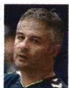
Rolando Freitas Selecionador nacional

"Estamos a preparar o futuro da Seleção Nacional"