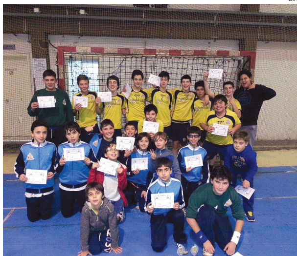
Atletas das equipas de Infantis e Minis masculinos do Alvarium