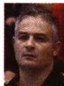
Rolando Freitas Selecionador nacional

"Não é a primeira vez que isto nos acontece"