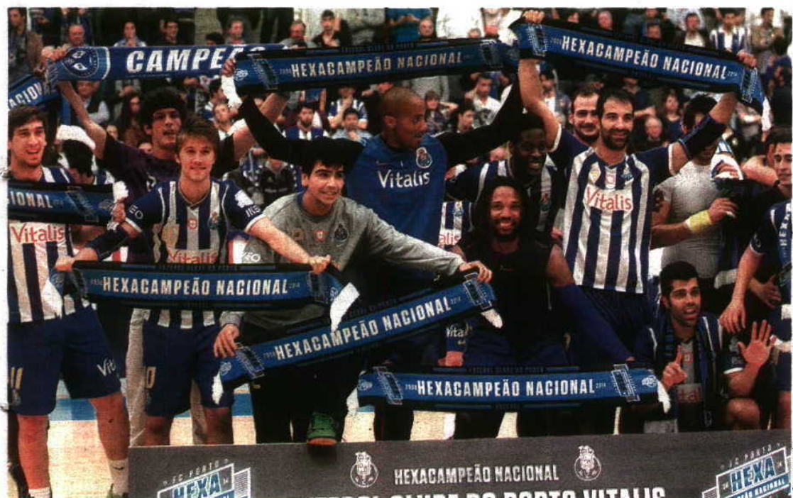
FESTA. Apenas o FC Porto conseguiu seis Campeonatos Nacionais consecutivos

ANDEBOL → FC PORTO CONQUISTADOR NO MELHOR INÍCIO DE SEMPRE