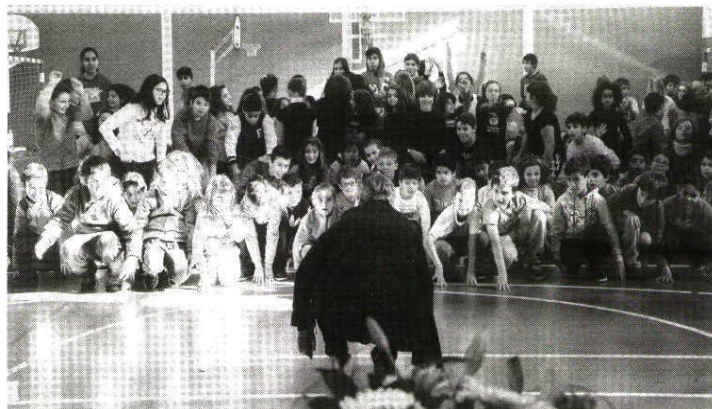
O protocolo foi celebrado com uma Festa do Andebol