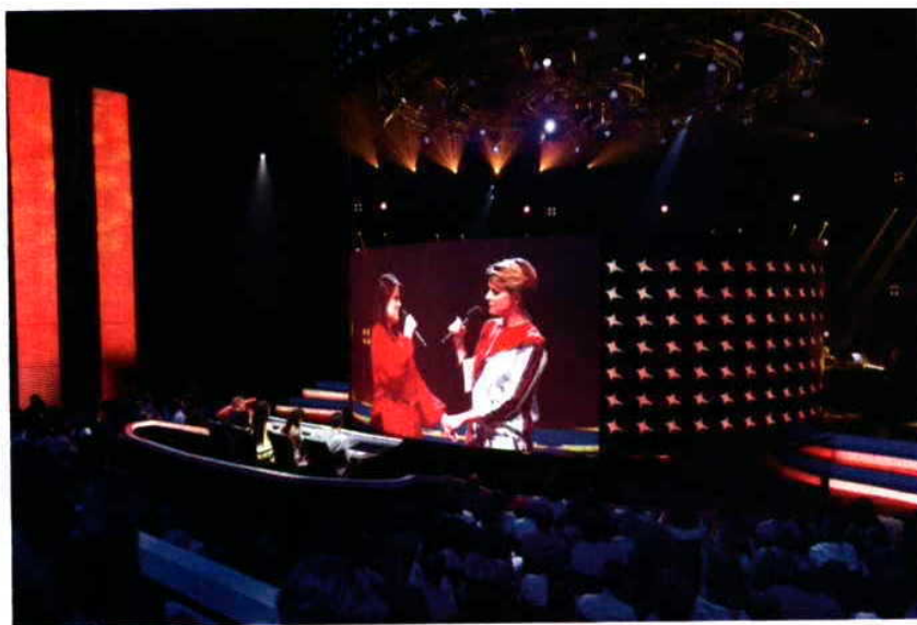
Empresa de produção e meios técnicos é responsável pelo grande ecrã de 'Rising Star - A Próxima Estrela', da TVI