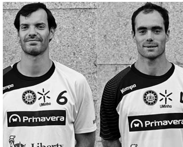
Os dois atletas vão continuar vestidos de amarelo na próxima temporada

A primeira jornada de captação decorreu no passado sábado com resultados muito positivos. Mais de 30 jovens vieram conhecer a nova realidade desta parceria. No próximo sábado há nova jornada de captação, desta feita para júniores, pelas 15 horas, no Pavilhão Flávio Sá Leite.