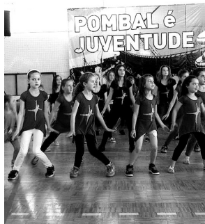
Certame propõe uma vasta panóplia de actividades

ANIMAÇÃO «Divulgar o trabalho que é realizado no concelho pelas entidades que acompanham as camadas mais jovens» é um dos objectivos da Câmara de Pombal ao organizar, através da sua Unidade de Desporto e Juventude, a V Feira da Juventude, que decorrerá de hoje a domingo na Zona Desportiva. Segundo a autarquia, «numa relação de parceria» do município com