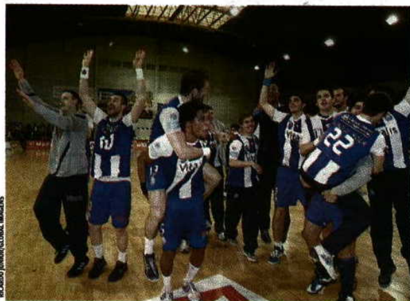
Festa > Este foi o tetra portista, celebrado na Mala

Nos últimos dois anos, o FC Porto foi campeão em casa do Águas Santas, celebrando o tri (2010/11) e o tetra (2011/12) antes do final do campeonato – à sétima e à oitava jornada, respetivamente –, mas esta época não será assim. Nesta segunda ronda da fase final (20 jornadas), a equipa de Ljubomir Obradovic joga em casa dos maiatos (hoje), que ocupam a quinta e penúltima posição. Ora, o FC Porto é segundo classificado, com 35 pontos, os mesmos do líder Benfica (recebe o Horta), não