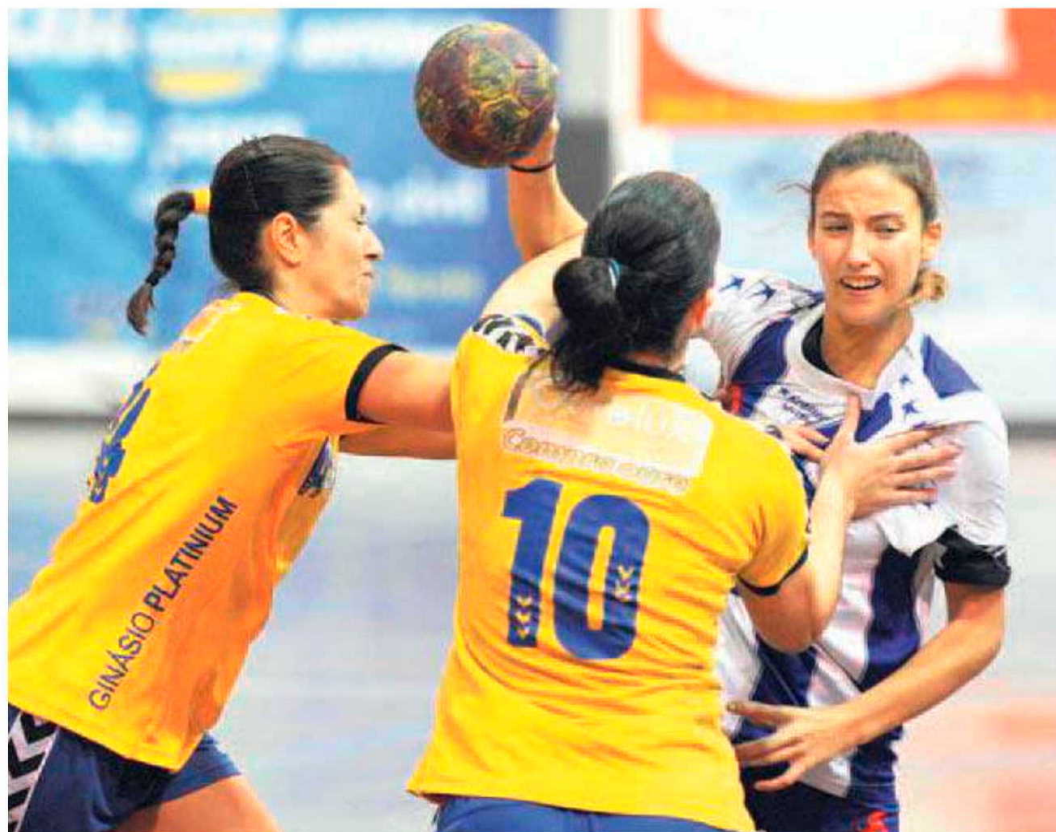
A Associação pode apadrinhar projecto único para o andebol madeirense.

A captação e fomento do andebol junto dos mais novos adviria de um projecto conjunto com todos os clubes regionais. Ideias que têm