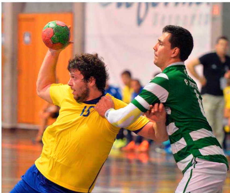
Injusta a derrota para o Madeira Andebol.

De resto, saliente-se, um jogo completamente marcado pela grande exibição dos comandados do técnico Paulo Fidalgo. Soltos, sem pressão e entregando ao seu opositor o natural favoritismo para esta partida, coube no entanto ao