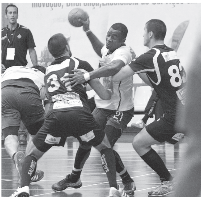
Madeira SAD apesar da luta acabou derrotado.

Madeira SAD e Sporting defrontaram-se na noite de ontem em partida a contar para a 7.ª jornada do Campeonato Fidelidade Andebol I. Num embate muito equilibrado, os continentais venceram os madeirenses pela margem mínima, 32-31. Numa partida quase sempre equilibrada, os madeirenses nunca se atemorizaram perante o poderio do adversário e pegaram no jogo desde o seu início, sendo que ao intervalo, a equipa madeirense estava em vantagem no marcador, vencia por 17-15,