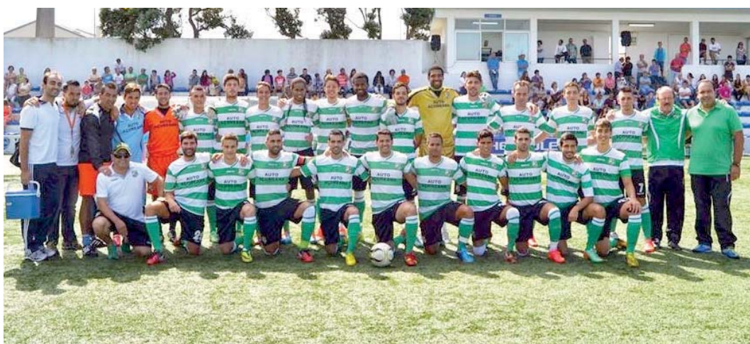
Sporting Ideal foi o clube de São Miguel que mais verba recebeu em 2014/15

Já estão definidos os montantes de apoio aos clubes açorianos que competem nas provas nacionais e regionais com atletas formados nas colectividades e nos Açores.