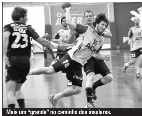
Mais um "grande" no caminho dos insulares.