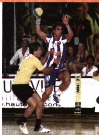
Duelo promete ser animado

A fase final não começou bem para o ABC, que regista três derrotas em outros tantos jogos, mas os bracarenenses recebem hoje o líder FC Porto e têm em mente repetir a vitória alcançada na fase regular, em casa. Contudo, este pavilhão é igualmente de boa memória para os campeões nacionais, que ali festejaram o título na época passada e a recente vitória, por 43-22, elevou ainda mais os ânimos dos dragões que estão na liderança, embora a concorrência continue perto, nomeadamente a Madeira SAD (a 1 ponto), Benfica (a 2) e o próprio ABC (a 3). Este será o único jogo de sábado, pois a 4.ª jornada da fase final completa-se domingo com dois jogos igualmente eletrizantes: Sporting recebe o Águas Santas, com ambas a virem de derrotas no Funchal e no Dragão, mas outro resultado que não a vitória condiciona as aspirações das duas equipas. No Funchal, a Madeira, que soma 6 êxitos e 1 empate, recebe o Benfica, equipa que impôs até agora uma das duas derrotas caseiras aos madeirenses na fase regular. No grupo B, o Ac. S. Mamede-Sp. Horta foi