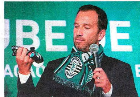
Medalha da Taça 2017/18 valeu promessa para o título

Apoiantes que se deslocaram à Praça Centenário, em Alvalade, para saudar o presidente recém-eleito, que não escondeu a sua emoção e as lágrimas no discurso