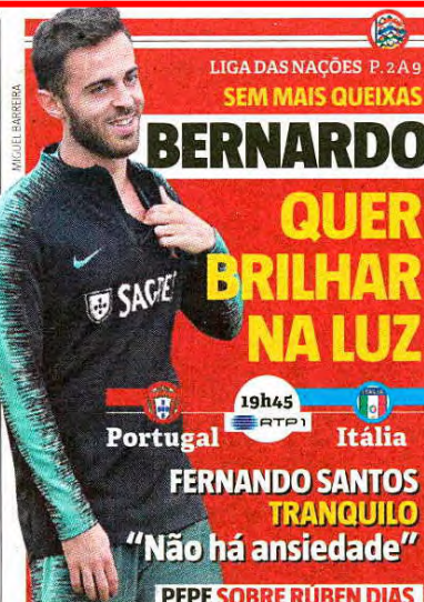
LIGA DAS NAÇÕES P. 2 A 9