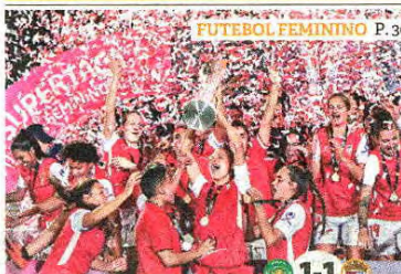
FUTEBOL FEMININO P. 30