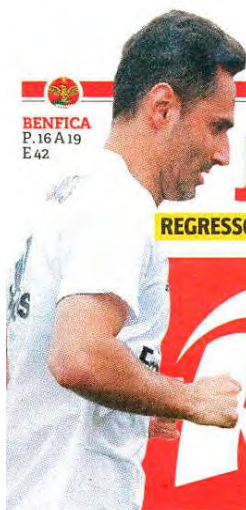
BENFICA P. 16 A 19 E 42