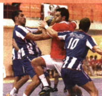
Benfica-FC Porto não está em causa