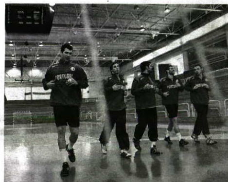
Estágio > Internacionais preparam recepção à Polónia

tem empenho e concentração para contrariar o favoritismo do adversário. Recorde-se que este grupo apura os dois primeiros classificados para a fase final do Europeu. Os 18 convocados não têm problemas físicos e ontem revelaram enorme determinação em cumprir as instruções do treinador sueco, cujos treinos, como se sabe, são exigentes. M.R.